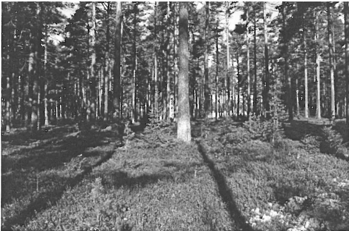
Kuva 2. Muhos Laitasaari Päivärinne. Yleiskuva kuoppajäännealueesta kohti. Taustalla parantolarakennus. Kuvattu itä-kaakosta.