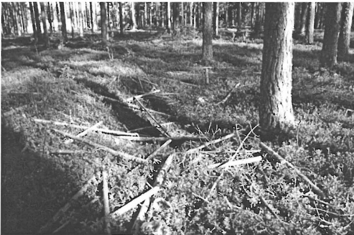
Kuva 4. Muhos Laitasaari Päivärinne. Hiilensekaisen huuhtoutumiskerroksen sisältänyt kuoppajäännös 7. Kuvattu kaakosta.