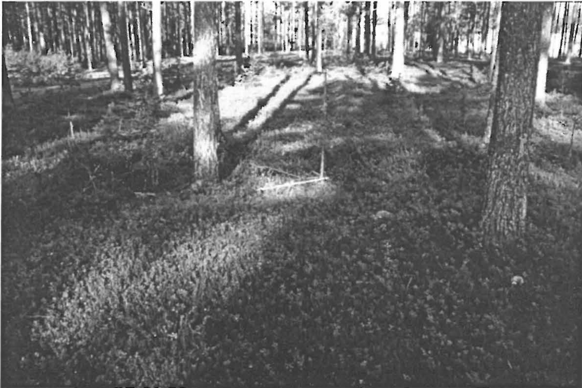
Kuva 3. Muhos Laitasaari Päivärinne. Etualalla huonosti kuvasta erottuva, neliömäinen kuoppajäännös 4. Kuvattu itä-kaakosta.