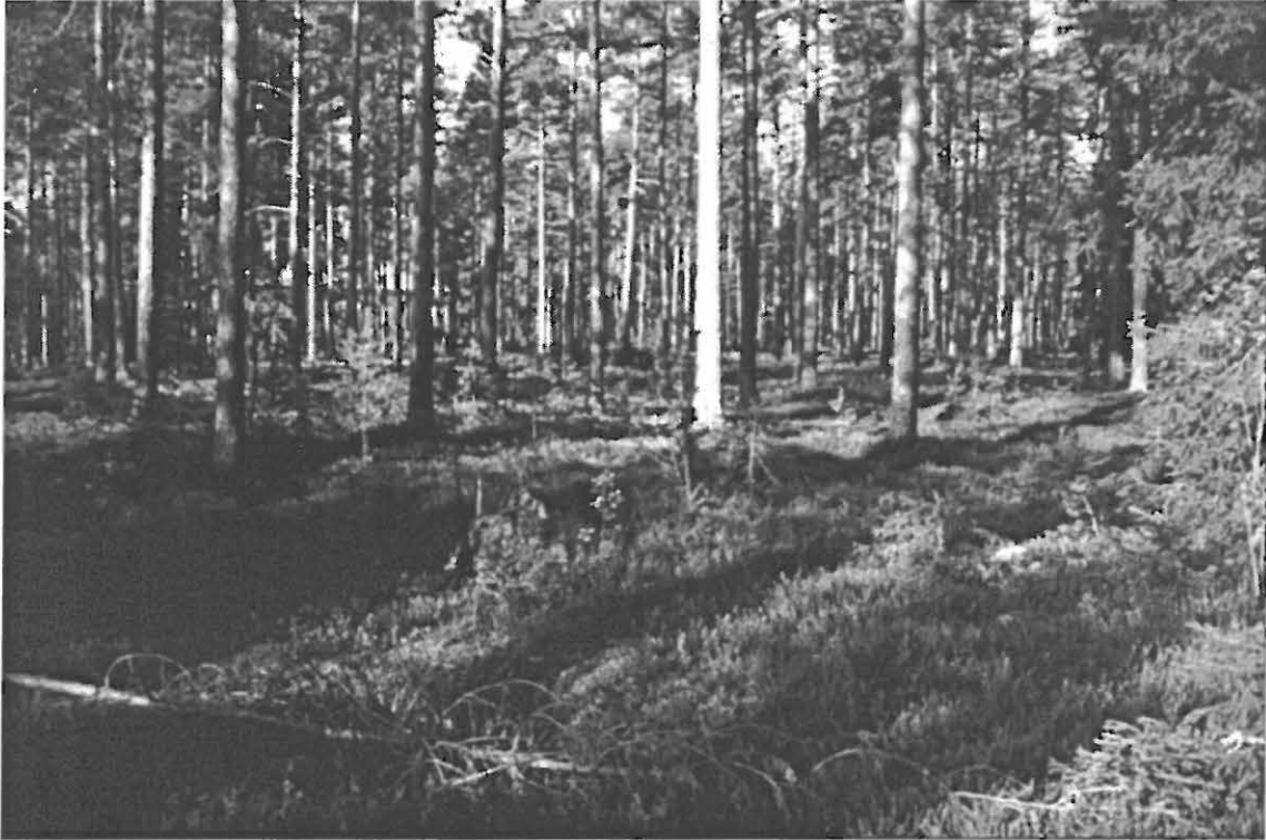
Kuva 1. Muhos Laitasaari Päivärinne. Yleiskuva kuoppajäännealueesta. Taustalla parantolan asuntolarakennus. Kuvattu itä-kollisesta.