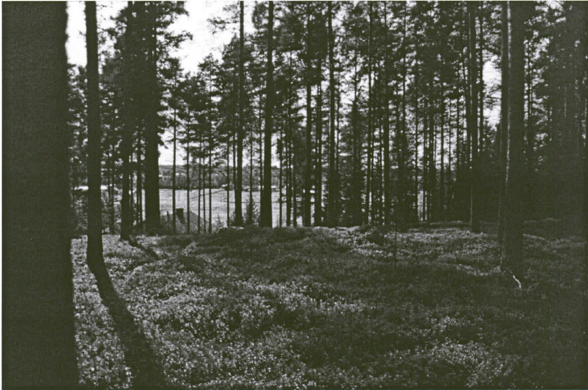
Kuva 1. Muhos Laitasaari Ritokangas. Näkymä kankaan laelta kohti Oulujokivartta ja Vaalantietä. Kuvattu koillisesta.