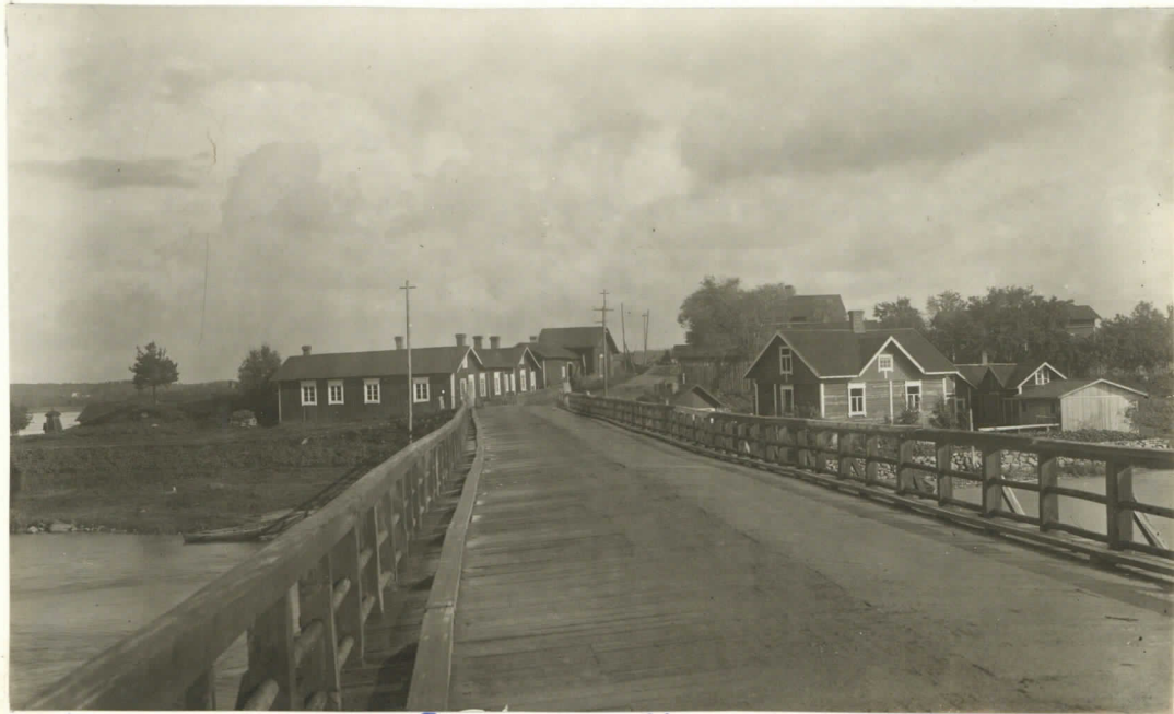
Kuva 2. Sama kuin edellä. Kalmisto kuvassa korkeimman puitten ja telefontolppain vä- lillä.