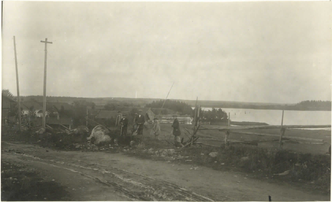
Kuva 1. Väihmalan harjun rautakautinen työpaikka Seppä Nurmen pajan kohdalla.