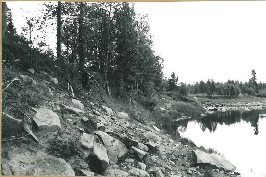
Kuva 2 ( f. 75066)