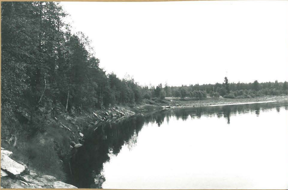
Kuva 1 ( f. 75065)