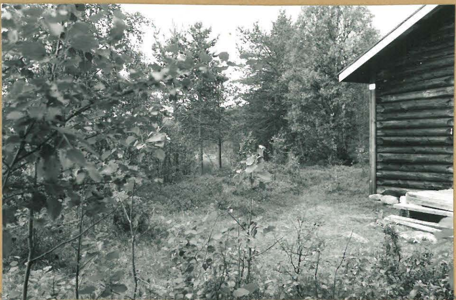
Kuva 3 ( f. 75067)