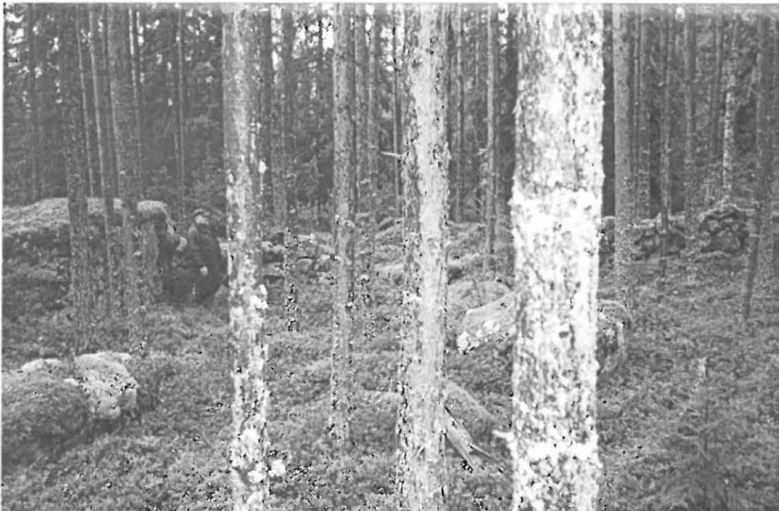
Kuvassa keskellä toinen pisteiden 2 ja 3 välissä olevista "itseromahtaneista" aukoista ja yksi aidassa olevista siirtolohkareista.