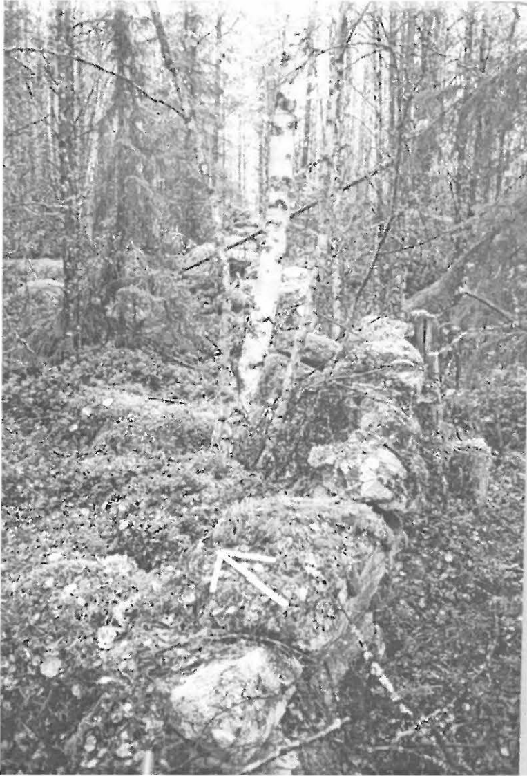
Kaatuva kiviäitä pisteeltä 1 koilliseen.