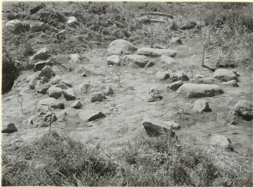
Lieta, Hukkunanmäki. Kaivausalue N:stä päin turpeen poistamisen jäl- keen. Levy N o 9526.