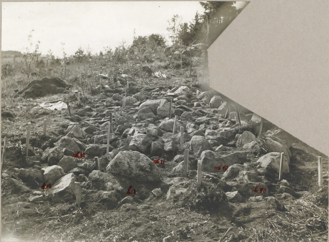
5. Merola gravfält 1931. Rötorna l-u x 10-12 efter tårnens borttagande. pl. 7989.