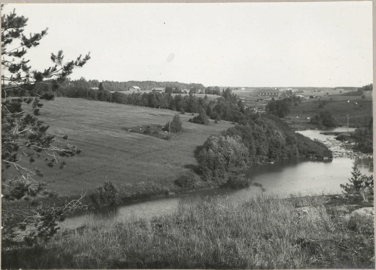
15. Taustassa „Uhran kalliö”. Keskellä kalliö, jolla ennen on ollut röykkiö. Katsottuna Wistä O-päin