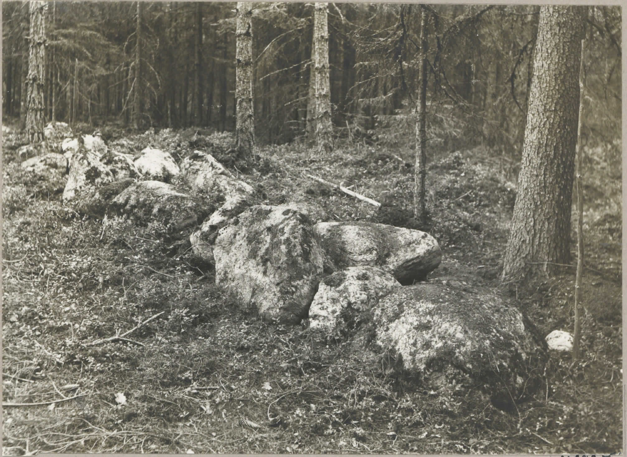
12. Stenvall i ylikirki hemmans Värämetsä skog, pl. 7997. Vantala by, Lundo socken 1931.