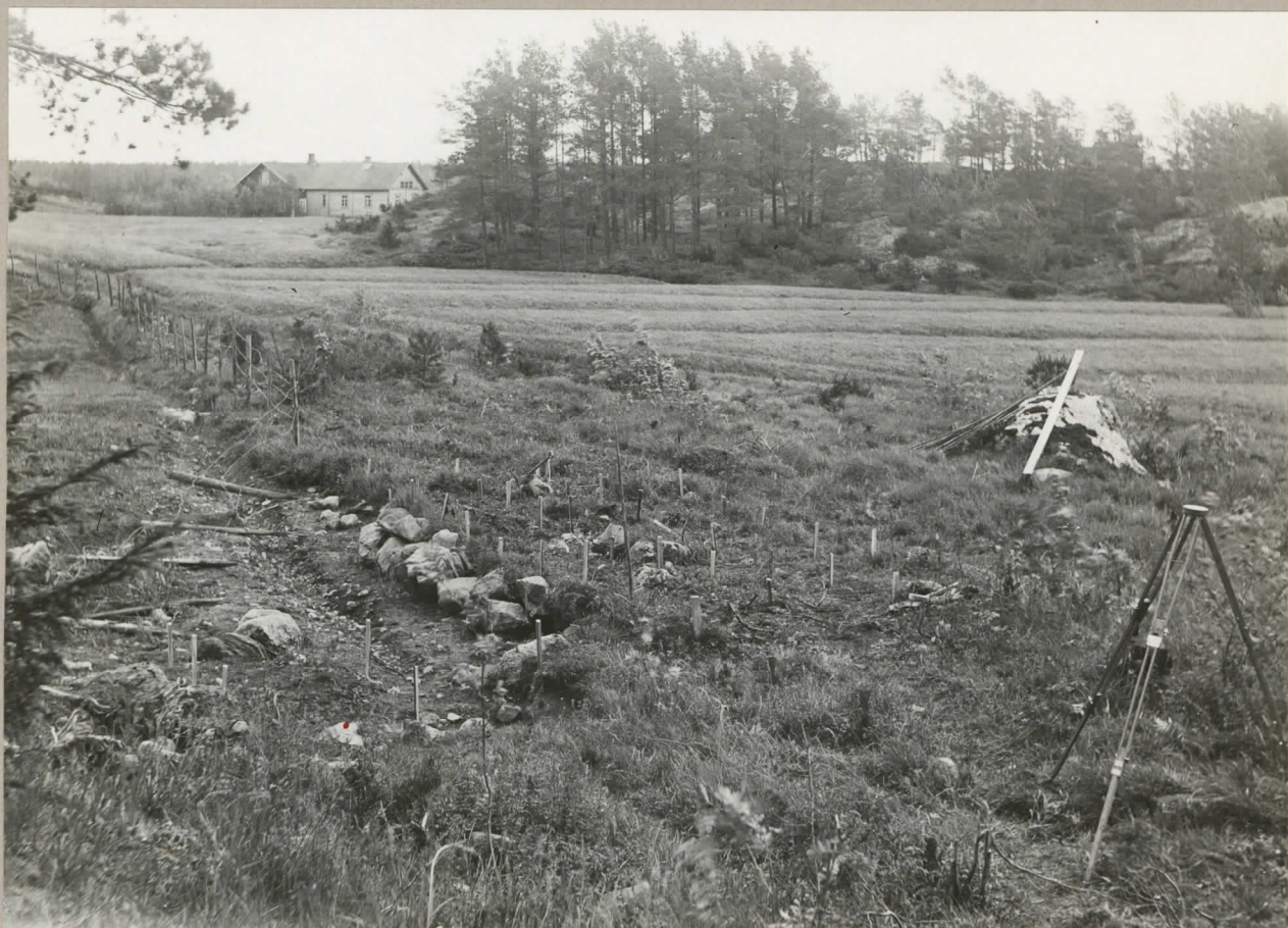
4. I mitten och i förgrundens grävningsområde pl. 7988. 1931 före undersökningen.