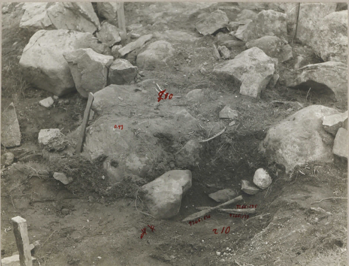
8. Spjutspetsarna 9366:135, 136 och kniven 137 in situ. pl. 7991.