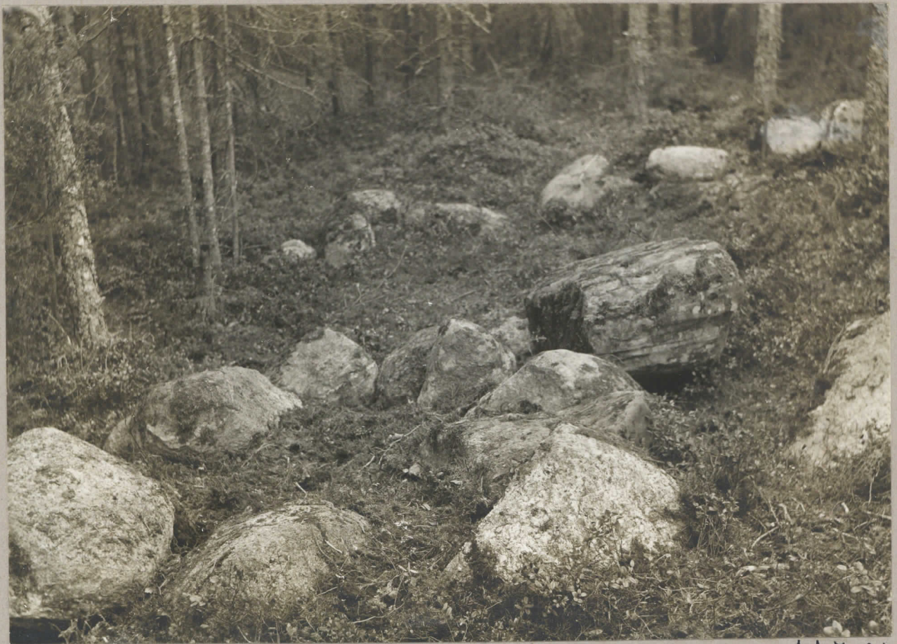
13. Stensättning invid stenvallen, vars nord- östra ändan synes i bakgrunden. pl. 7996.