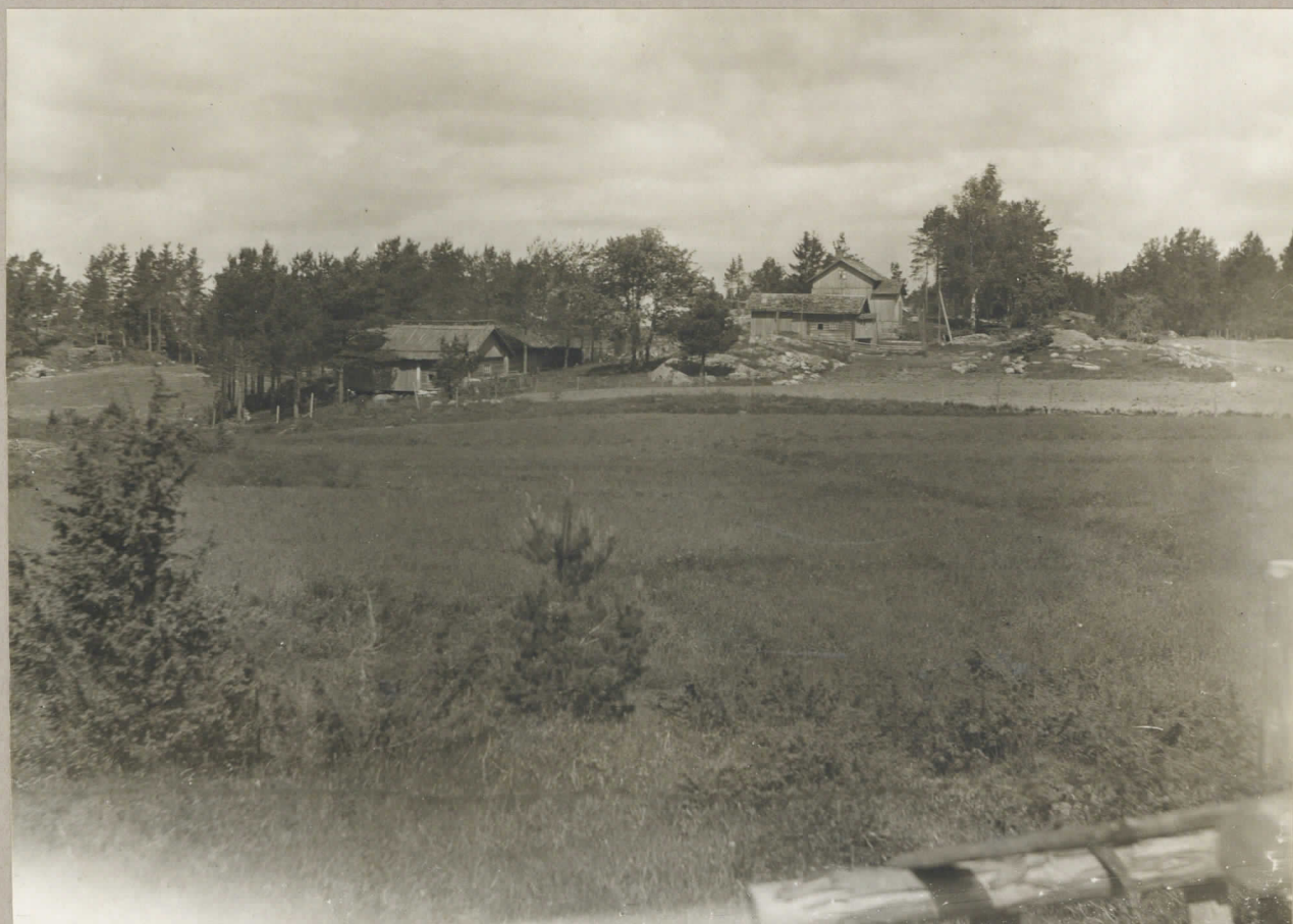
1. Merola, sett från S.