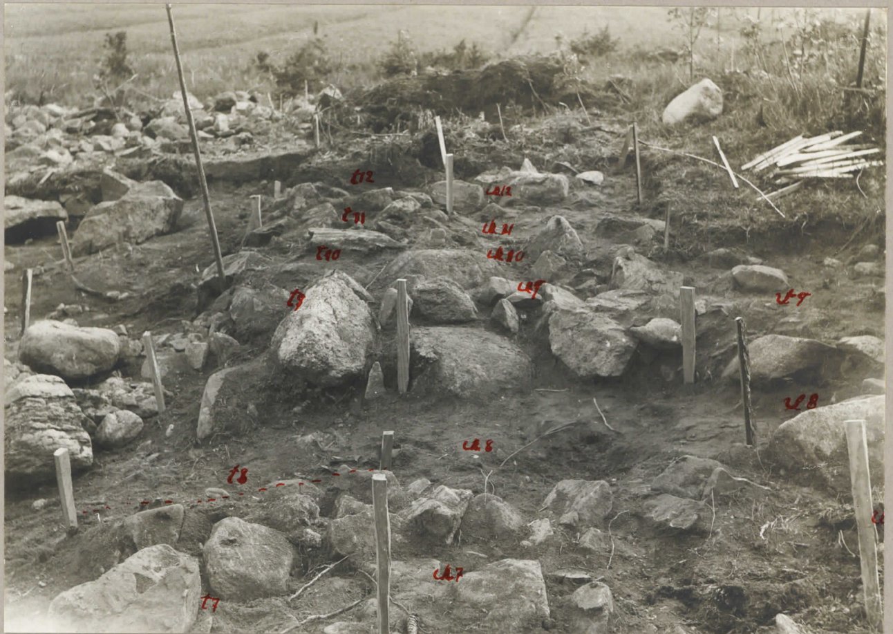
9. Merola gravfält 1931. Rötorna t7, u7, t-u x 9 pl. 7994 + 12 u8 u9 efter torvens borttagande. t9 och u8 redan undersök- ta 1930.