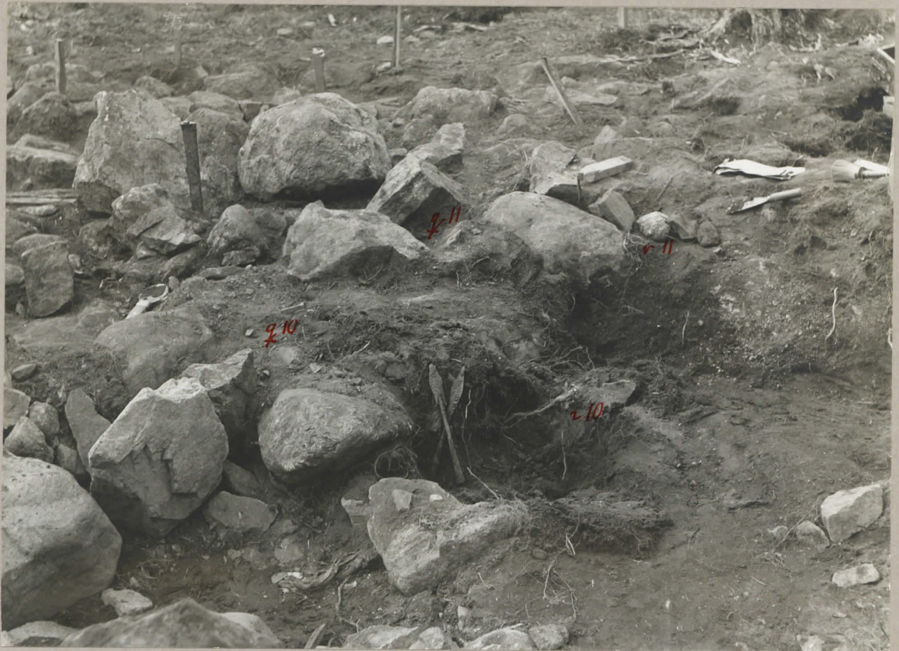
7. Merola gravfält 1931. Spjutspetsarna 9366:138, 139 in situ. pl. 7990.