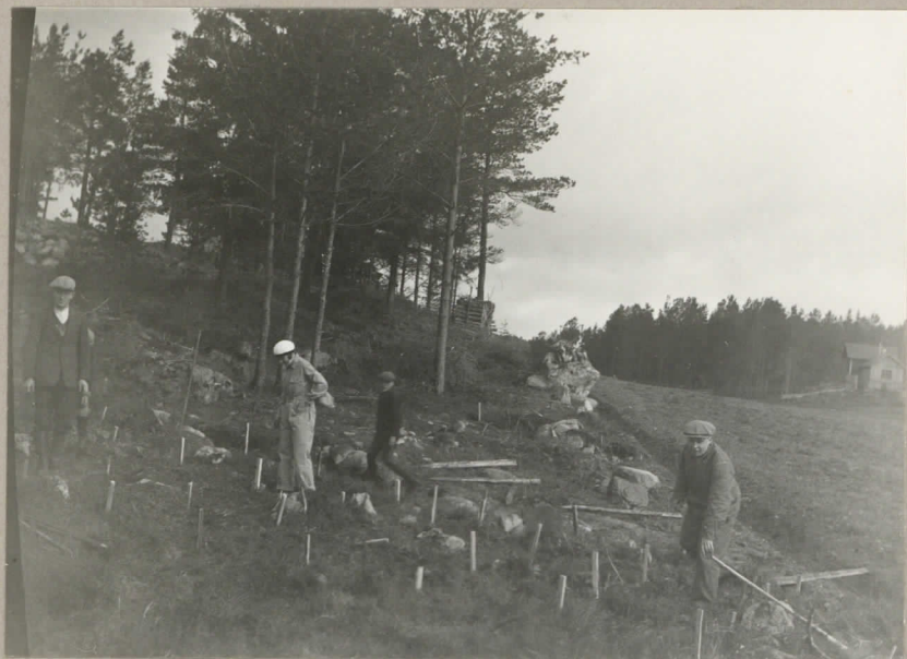
3. Merola gravfältets västra del. pl. 8023. 1931.