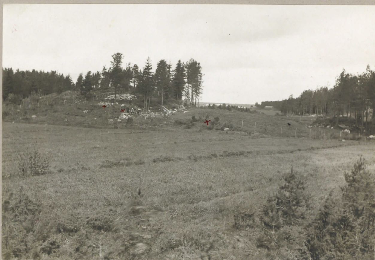
2. Vid + ett jordblandat röse, mellan de två x gravfältet. ungefär vid x skall svärdet Hm 9433 ha blivit!