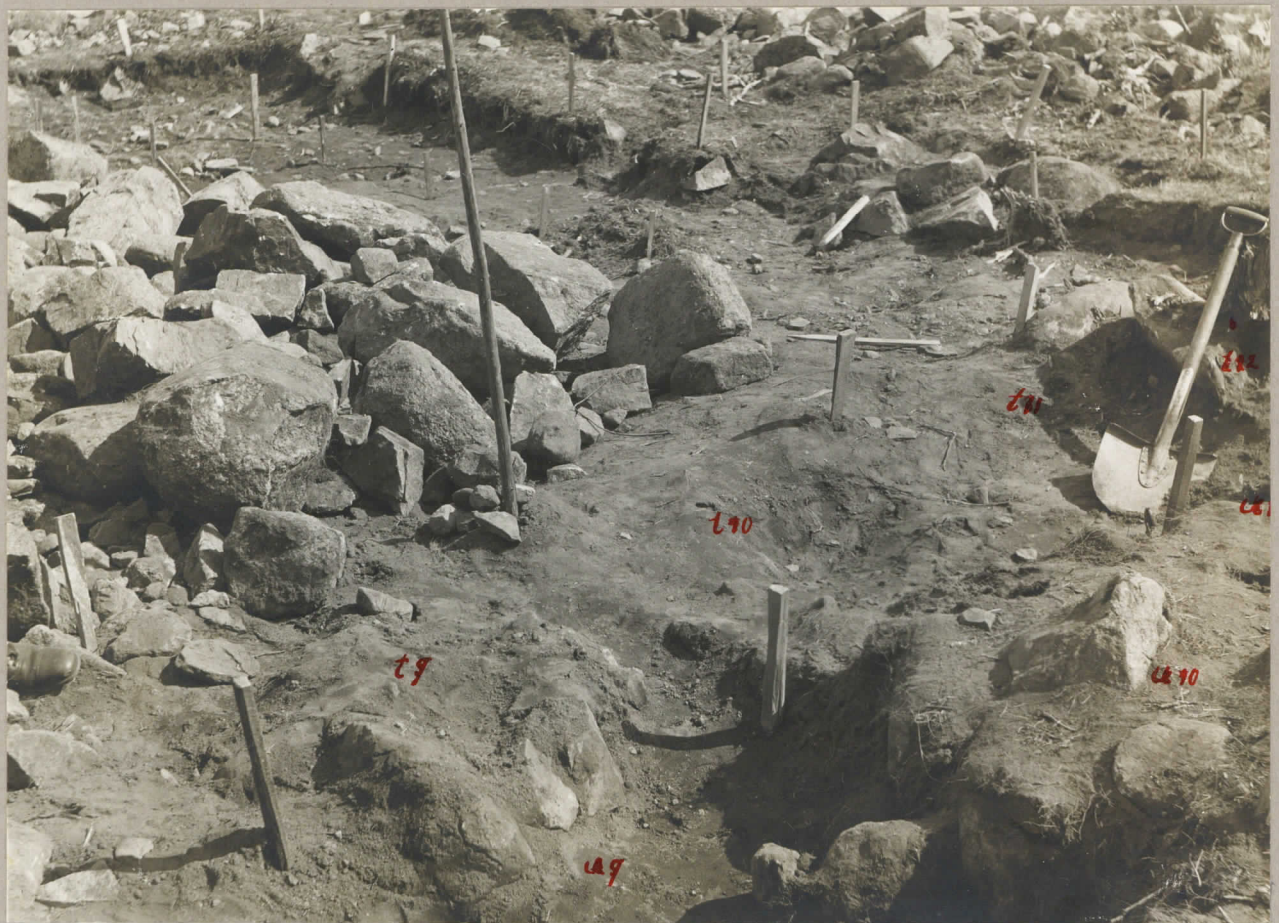
10. Rötorna t x 9-12, u9, u10 under undersökning. pl. 7993.