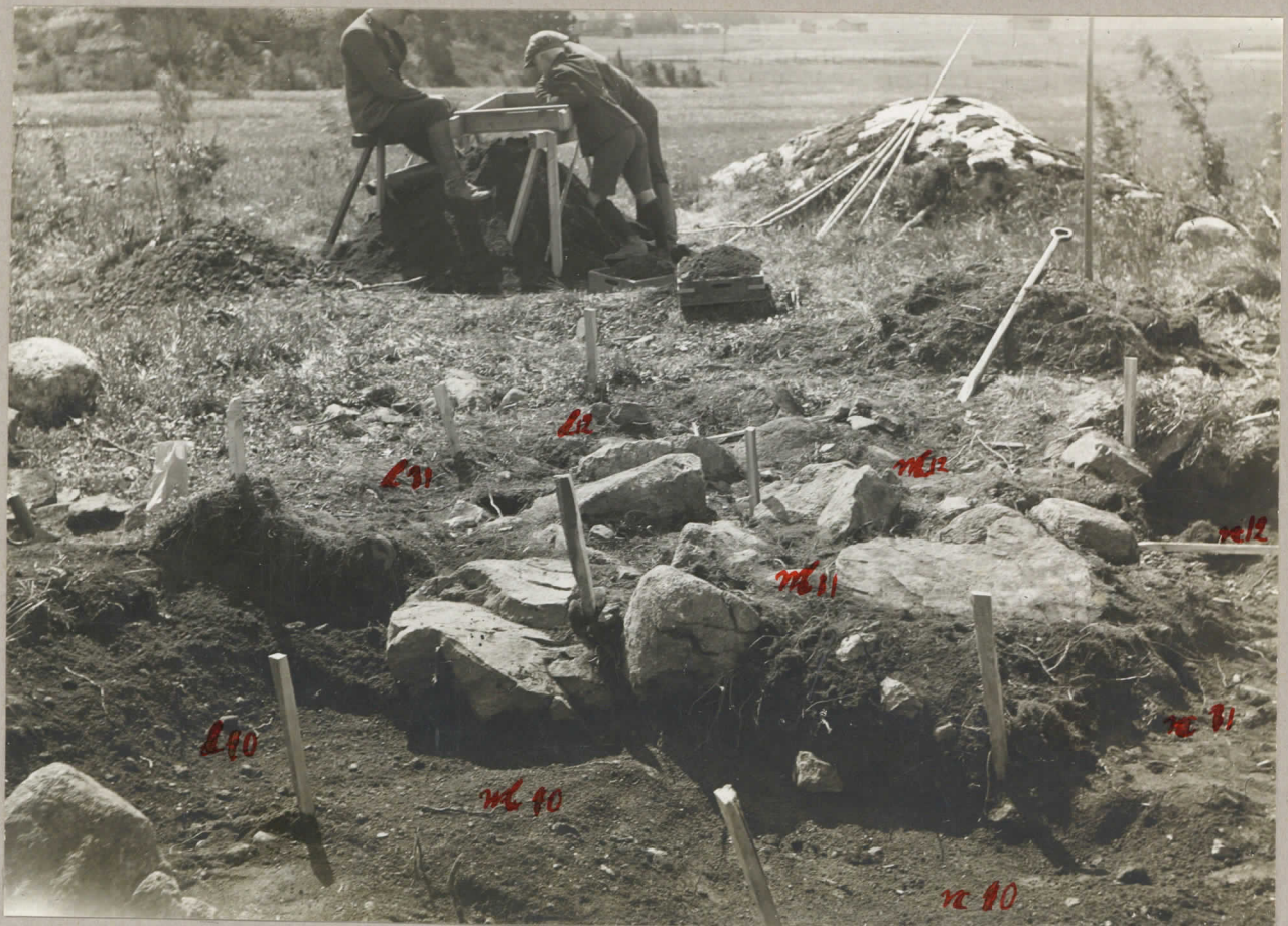
6. Rötorna l-m x 10-12. pl. 7992.