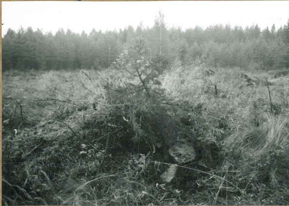
KUVA 1. ALUE 1: RÖYKKIÖ 1 IDÄSTÄ.