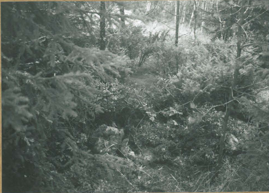
KUVA 4. ALUE 1: RÖYKIKIÖ 4 ETELÄSTÄ.