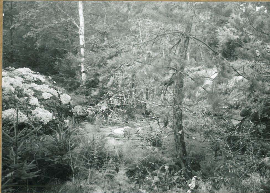
KUVA 3. ALUE 1: RÖYKKIÖ 3 POHJOISESTA.