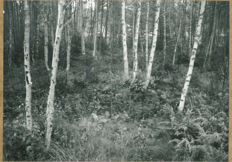
KUVA 2. ALUE 1: RÖYKKIÖ 2 LÄNNESTÄ.