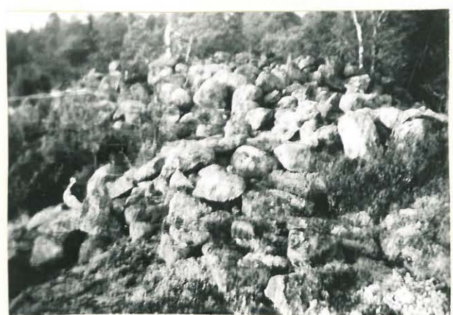
Kaurinmäen suurin raunio.