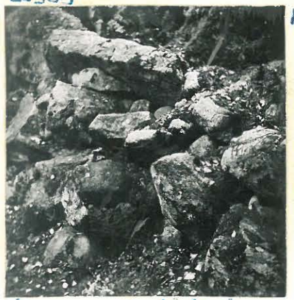
Linnavuori, Etelä-loun. rallitusta.