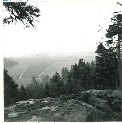
Näköala Linnavuorelta koilliseen. Flyvällä soella Pirttelin Linnavuori näkyvä tälle paikalle.