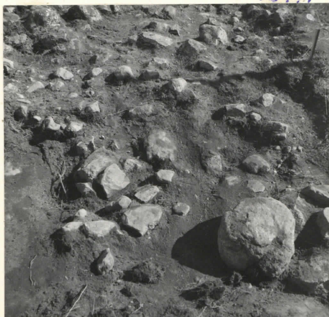
Ruudut 10, 11 - B