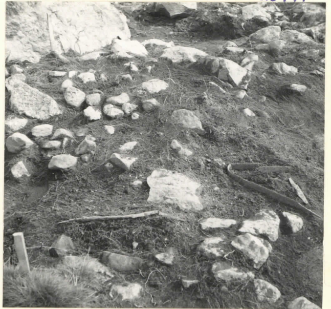
Ruutu 10 - c