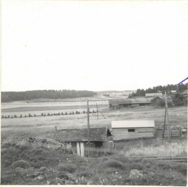
Maisema, launaasta, Pässimäki oikealla.