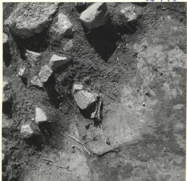
Ruutu D-10, löyö 1.