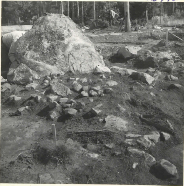
Ruudut 6, 8 - 10, 11