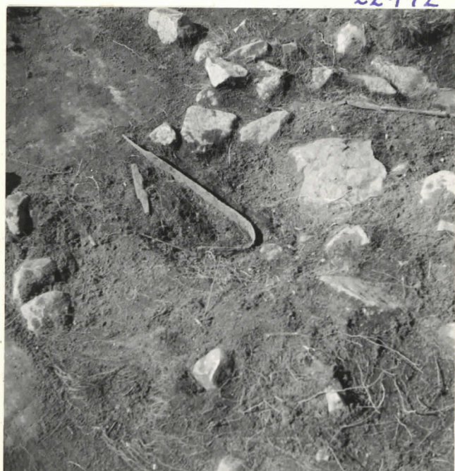
Reutu 10-C. löydöt 3, 4 ja 6.