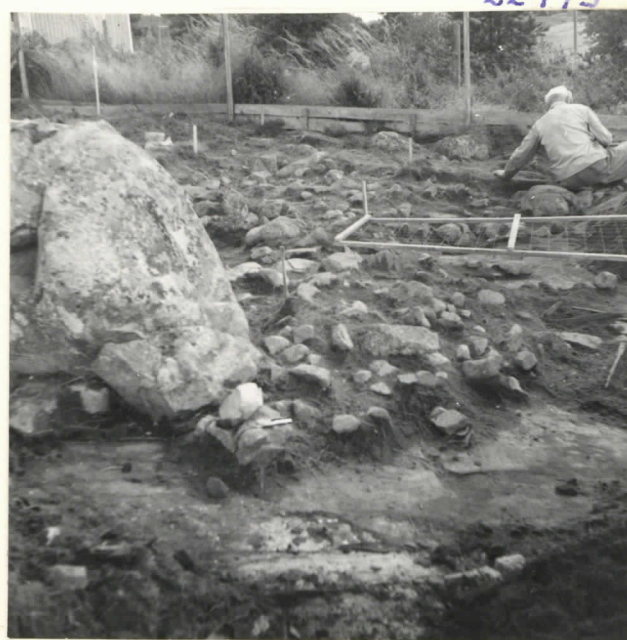
Kiveys ison maakiven (kps.) lounaisreunalla.