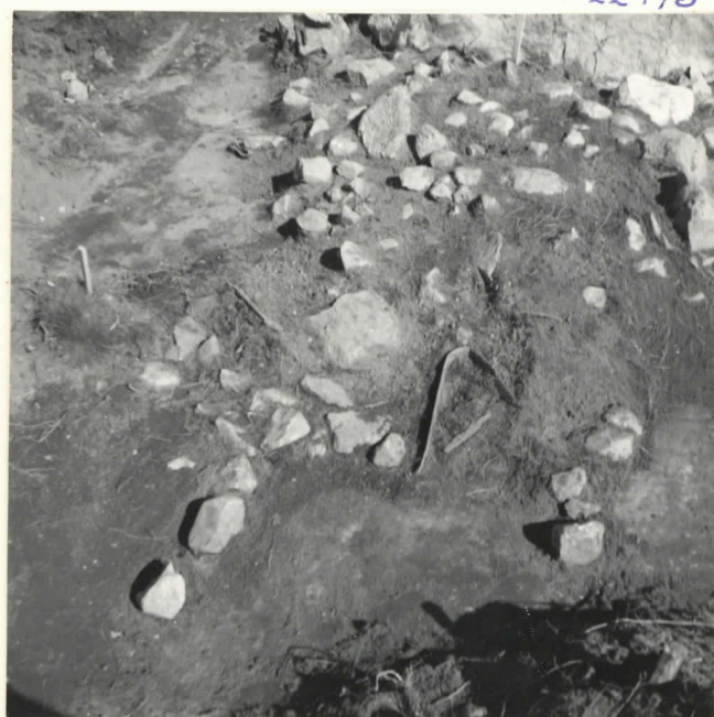
Reutu 10-C, löydöt 3 ja 4.