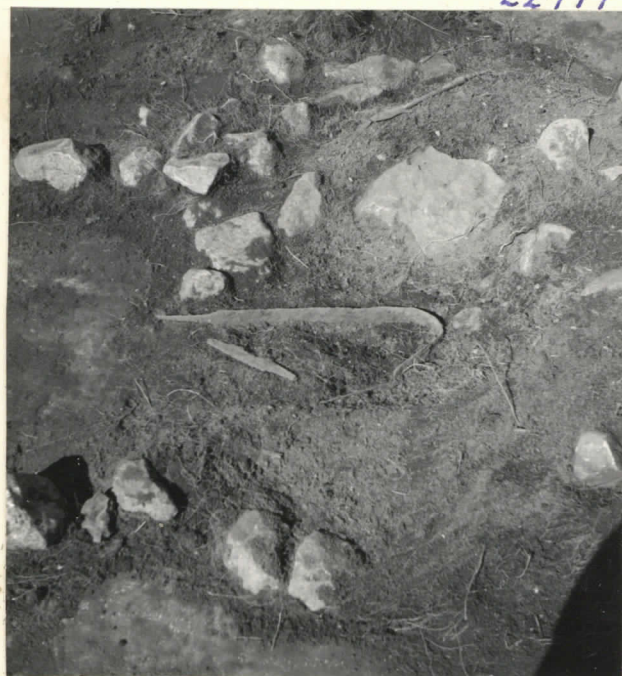
Ruutu 10-C, löydöt 3 ja 4.