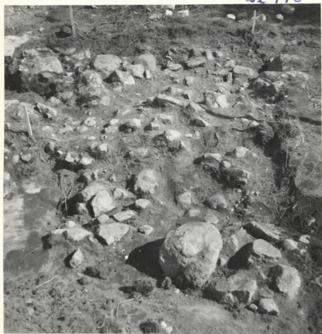
Ruudut 10, 11 - B.