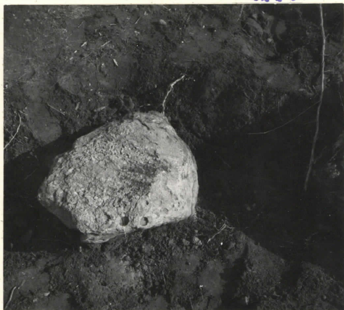
Uhrakivi(?) ruudussa B, C-18