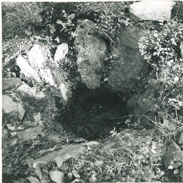
2. Kivilatomus sen jälkeen, kun keskuskivet oli poistettu. Niiden alla oli nokimaata rajoitetulla alueella kallion päällä.