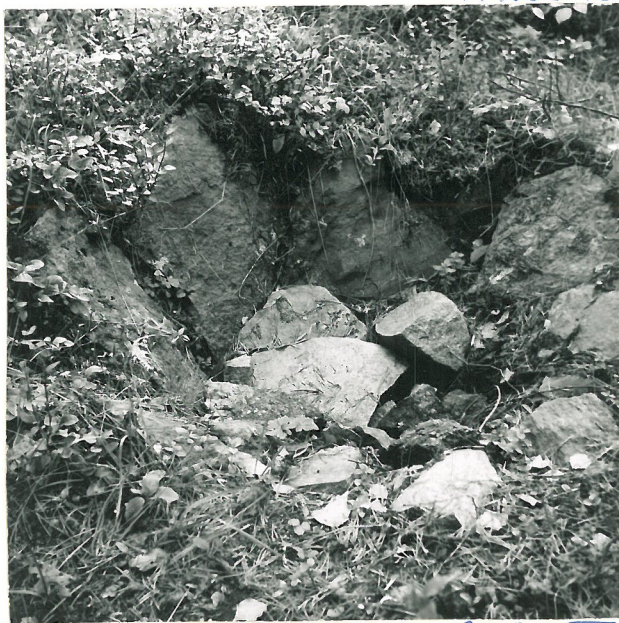
1. Nastolan Pyhäntään kylän Terwalan tilan maalla oleva kivi-latomus.