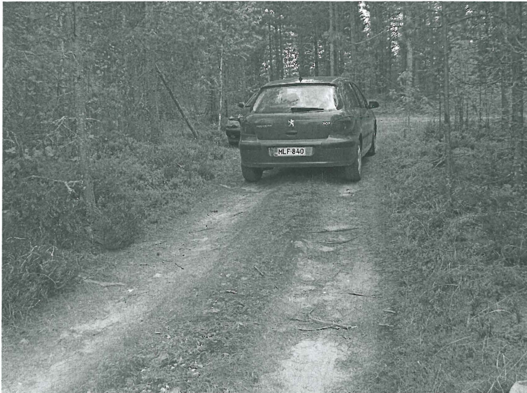
Kuva 1: Auton takana johtaa tie oikealle niemen kärkeen. Etualalla hiekassa kvartsi-iskoksia lännen suunnasta katsottuna.