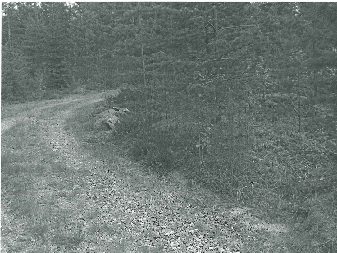
Kuva 2: Länteen rantamökille vievä tie, alempi terassi nähtynä lounaasta päin. Keraamiikan palaset (KM) löytyivät tien vieressä paljastuneesta hiekasta.