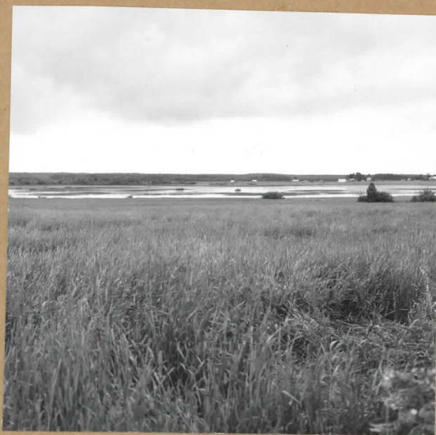
f. 60921 Kivikautinen asuinpaikka etualalla. Taustalla Erkkisjärvi. Kuva lännestä.

NIVALA 24. SARJA OJALEHTO Markku Heikkinen 1984