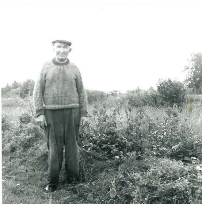
Mv Rikhard Kukkola kivikirveen KM 19381 löytöpaikalla. Kuvattu luoteesta.