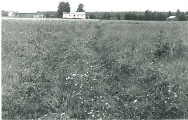
Jänesniityn kivikautista asuinpaikkaa kuvattu koillisesta. Kuvan etualalla turpeen alla tulisijoja tien kohdalla ja sen eteläreunassa. Taustalla Väliojan talo.