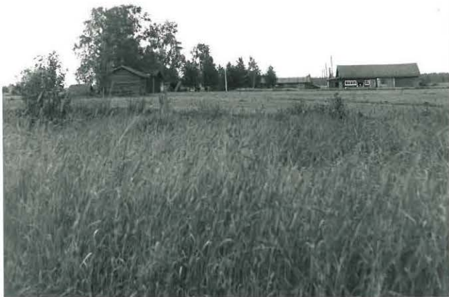
Jänesniityn kivikautista asuinpaikkaa, kuvattu luoteesta. Taustalla Piippolan talo.