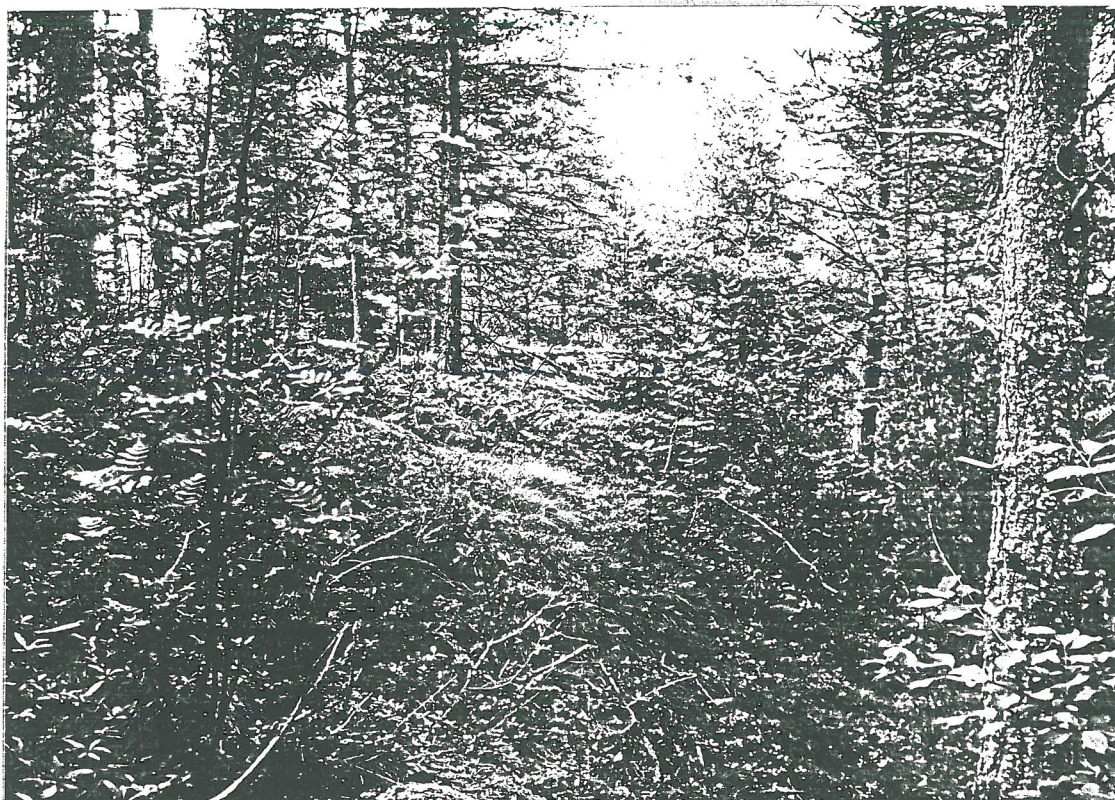
Granströmin mäki, nokisen maan aluetta, etelästä. TYA 9810