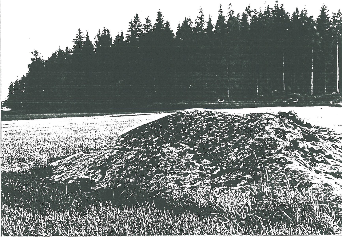
Pilpolan loppikallio, loppien sijainti (2 ryhmää). Koillisesta. TYA 0781