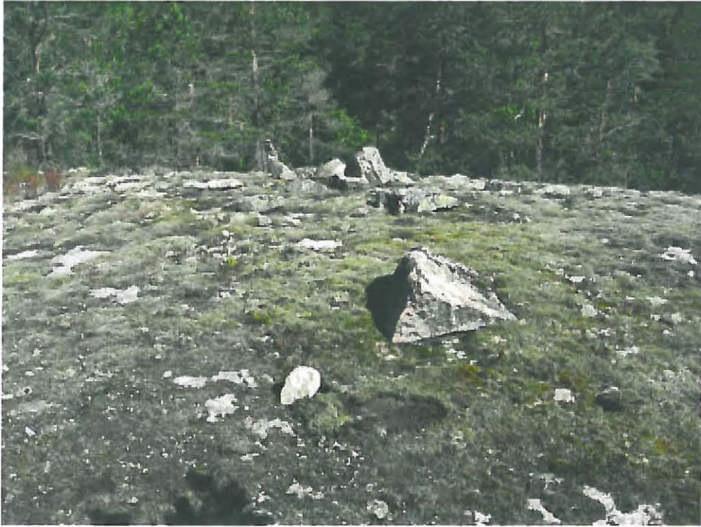
3. Nousiainen Ramaharja 2. Kivivallin jatkeena kallion päällä olevan kivirivin pohjoisosaa, etelästä. DT2010:20:2:025