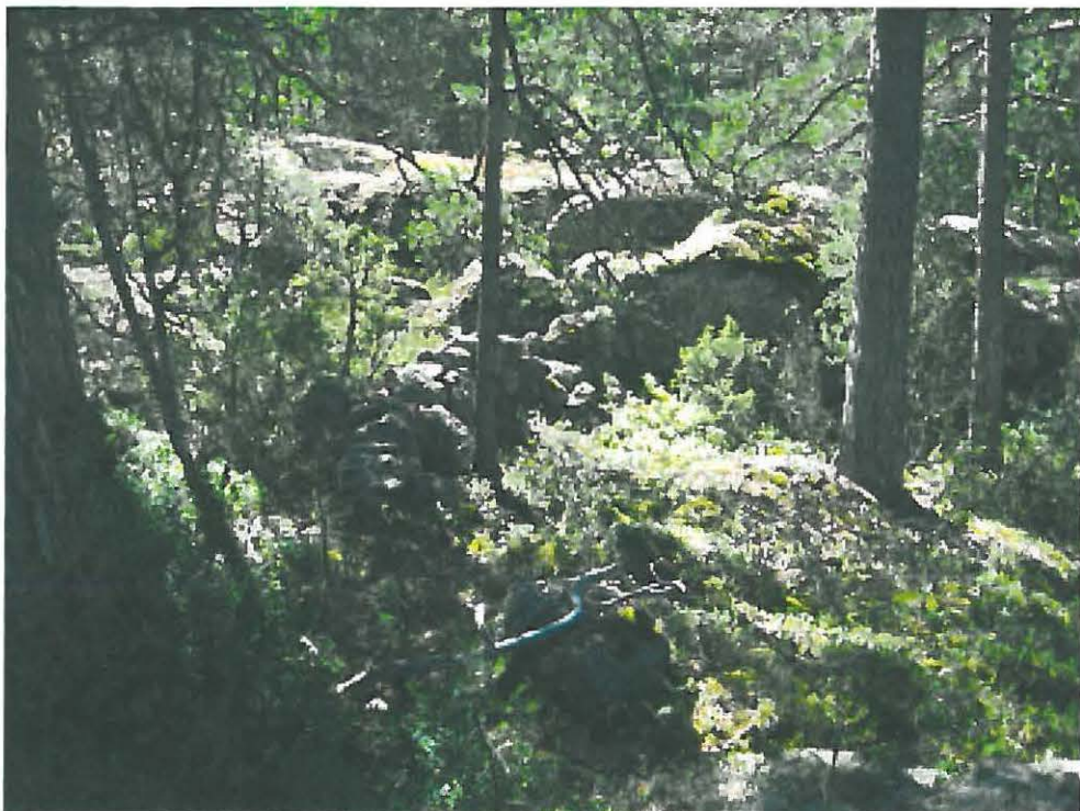
2. Nousiainen, Ramaharja 2. Kallioiden välissä oleva kivivalli, pohjoisesta. DT2010:20:2:027