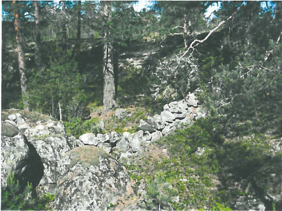
1. Nousiainen, Ramaharja 2. Kallioiden välissä oleva kivivalli, kaakosta. DT2010:20:2:028