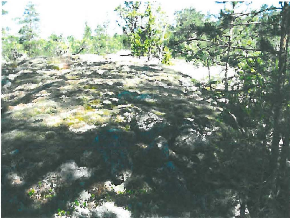
4. Nousiainen Ramaharja 2. Kivivallin jatkeena kallion päällä olevaa kiviriviä, etelästä. DT2010:20:2:026