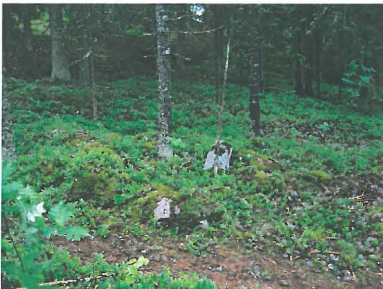
Nousiainen, Haanmäki. Tilojen välinen rajakivi Haanmäen N-rinteellä. Kuva koillisesta. DT2009:32:20:100

Polun itäpuolella on toinenkin, mutta epämääräisempi rökkiö tai kivikko.