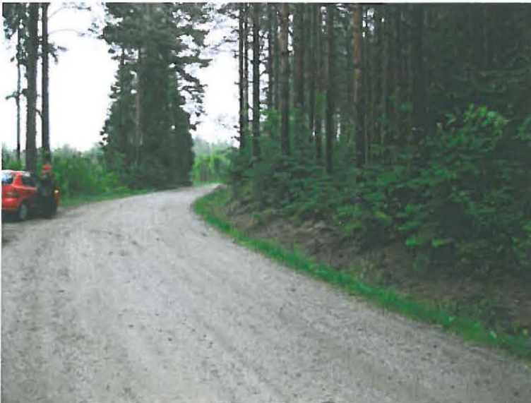
Nousiainen, Haverinnummen hiekkakuoppa. Kivikauden asuinpaikka-alueita tien itäpuolella (oikealla). Tien länsipuolella hiekkakuopan alueita. DT2009:32:23:043

Tien itäreunasta löytyneiden iskosten löytöpaikka on noin 75 m itään kyseisestä hiekanottoa paikasta. Uusien löytöhavaintojen perusteella ja maastonsakin puolesta hiekkakuoppien alueen kivikautinen asuinpaikka näyttäisi ulottuvan – jos ei yhtenäisenä, niin pesäkkeisenä – ennestään tunnettua laajemmalle alueelle mäen länsirinteellä. Tien itäreunan leikkauksesta, koordinaattipisteen molemmin puolin kvartsi- ja kivilaji-iskoksia löytyy ainakin noin 10 m:n pituiselta matkalta. Alue on metsää kasvavan mäen loivahkoa länsirintettä. Maaperä on hiekkää.