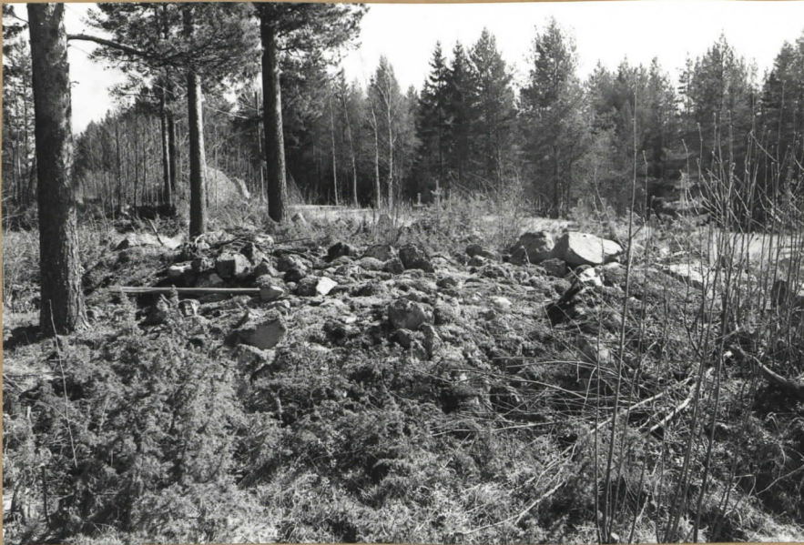
KUVA N. NW:sta