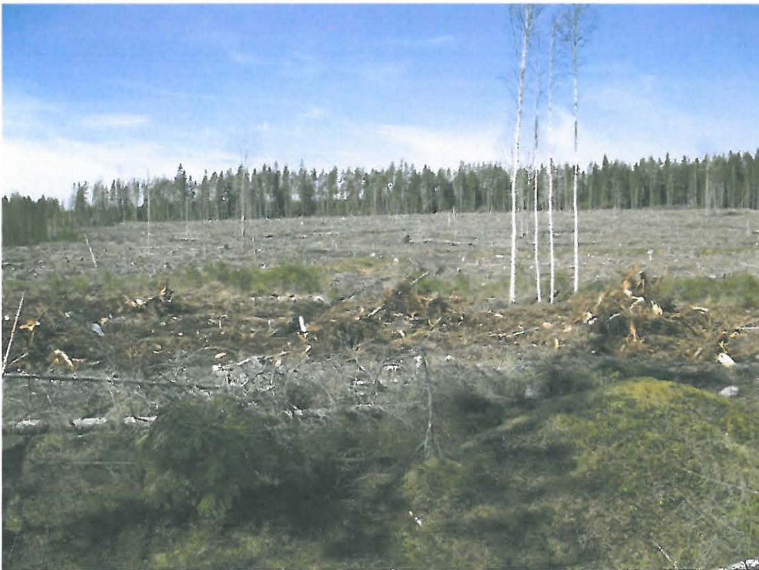
Kuva 6. Kumpareen laelta otettu kuva hakkuuaukealle. Koko hakattu alue on itäkaakkoon laskevaa laajaa kivikautista asuinpaikka-aluetta.