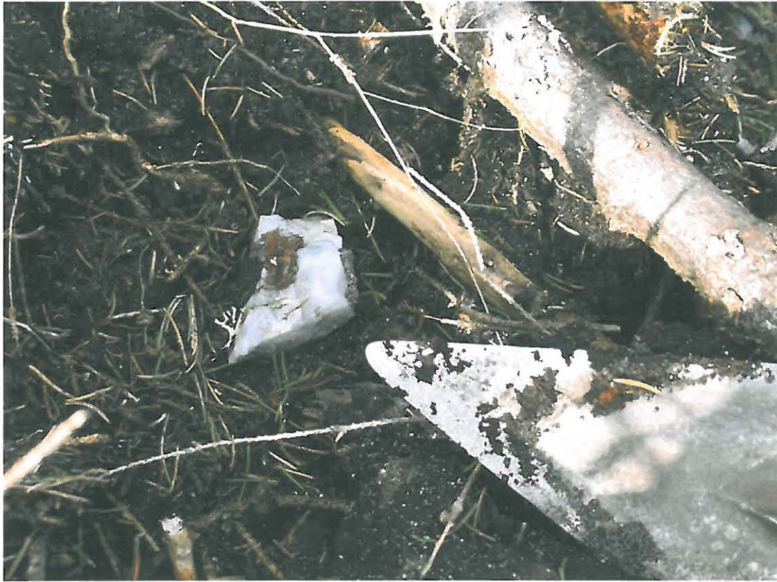
Kuva 3. Kvartsi-iskos, joita alueella oli muokatussa maassa näkyvissä erittäin runsaasti.