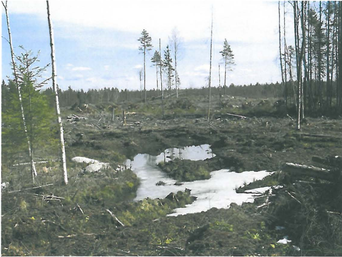
Kuva 1. Yleiskuva kannonnostoalueelle metsäautotieltä kuvattuna.