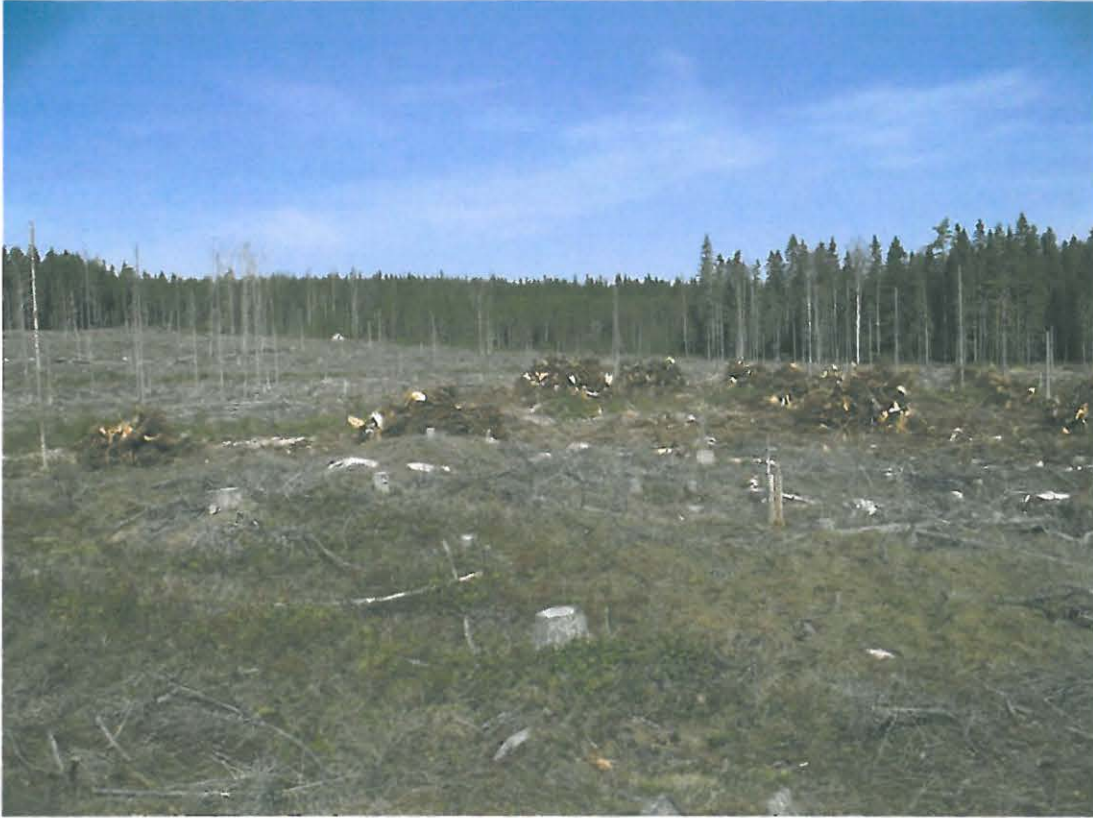
Kuva 5. Kuva otettu alueella olevan kumpareen laelta luoteeseen. Kuvan keskellä kantokasoja.