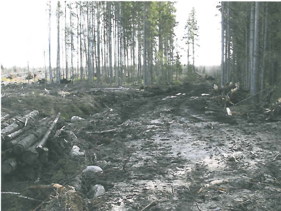
Kuva 2. Metsäautotieltä kannonnostoalueelle tehty ajoura. Kvartseja löytyi heti ajouran alkupäästä lähtien.