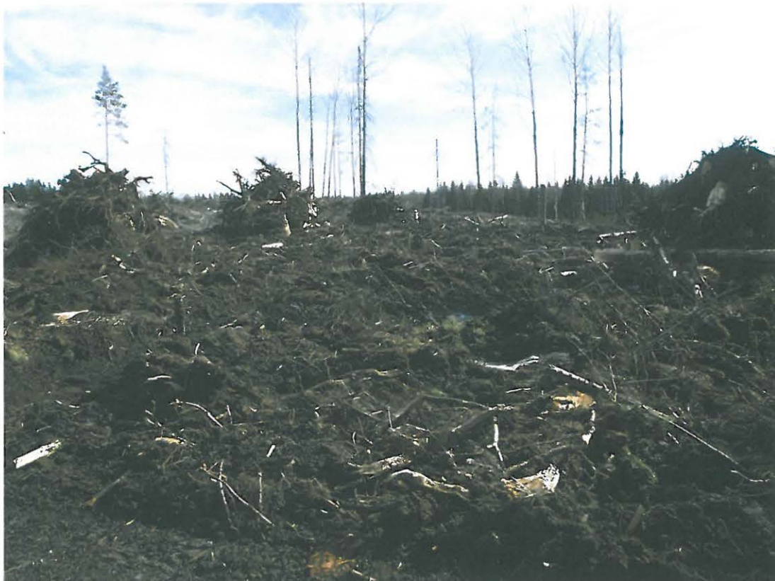
Kuva 4. Kivikautista asuinpaikka-alueita kannonnoston jälkeen.