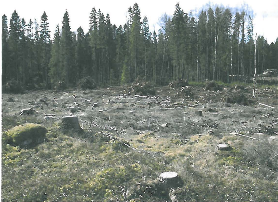
Kuva 7. Muokatun alueen lounaisosaa. Oikealla takana näkyy olemassa oleva metsäautotie, jolta ajoura kantojen nostoalueelle on vedetty.