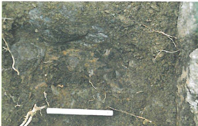
Kuvassa 20 cm mitta ja palojälkinen kallio, josta radiohiilinäytteen hiilet tulivat.