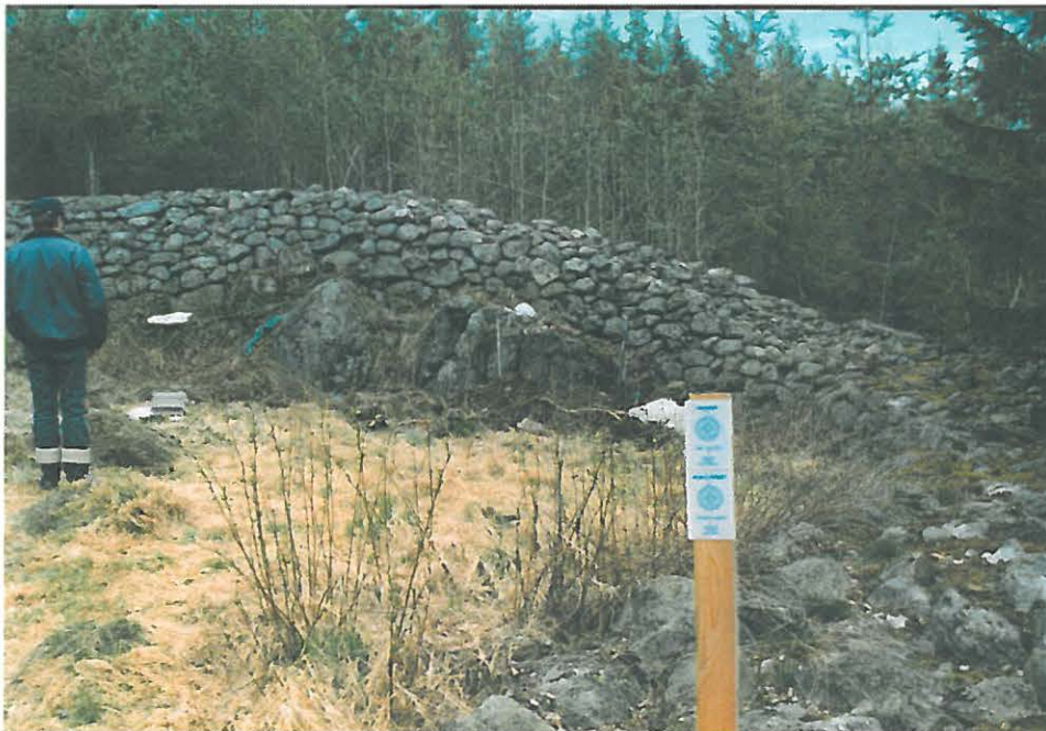
1999. Kallioreuna, jonka viereen tehtiin koeoja. Kuvattuna eteläreunan sisäänkäynniltä.