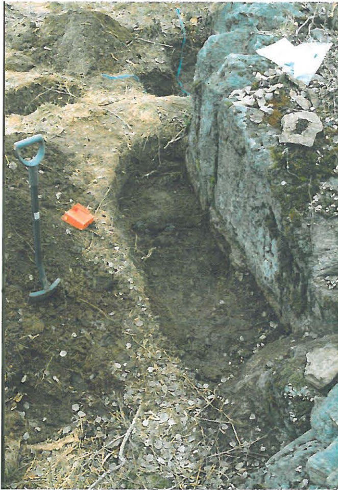
1999. Kaivanto kallioreunan juurella. Mullan ja moreenin rajalla erottuu jo kallio.