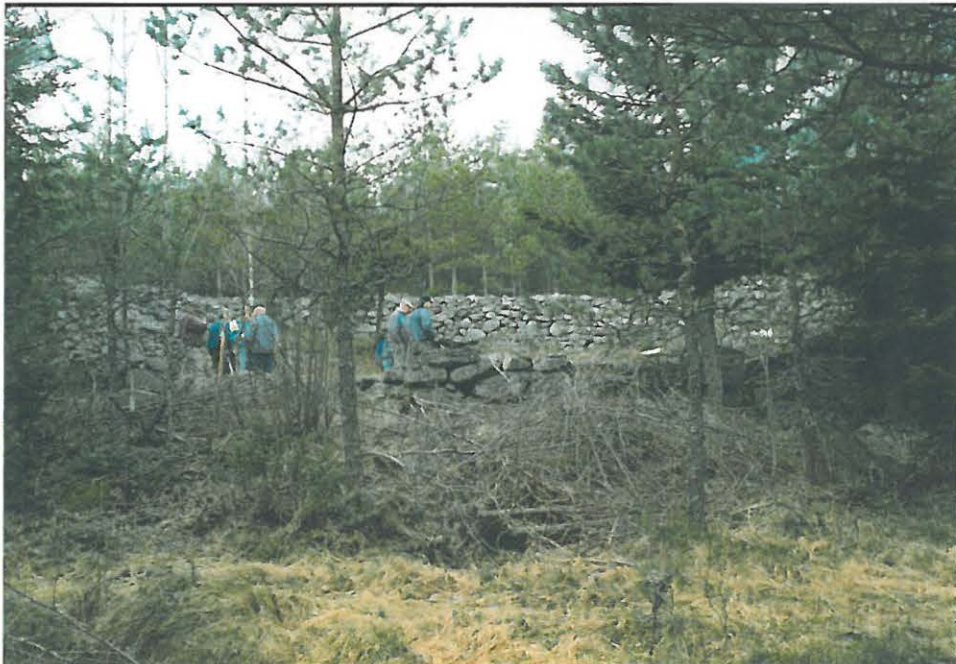
1999. Kehämuuri, jonka eteläreuna osin sortunut ja korjailtu sisäänkäynnin kohdalta.

Närpiössä Finbyn kylässä Nordströmin tilalla on kivistä kylmämuurattu kehämuuri, jossa on kulkuaukko etelään. Muurilla on yhteensä pituutta noin 50 m ja sen rajaaman kehän suurin halkaisija on noin 15 m. Muurin korkeus ja leveys vaihtelee noin metristä puoleentoista. Kehämuuri sijaitsee Muli (tai Nuli) berget nimisen mäen etelärinteen alaosassa lähellä nykyisiä viljelyksiä, mutta kuitenkin niin kaukana ylämäessä, että kivet tuskin ovat peräisin viljelyksistä. Mäellä on avokivikko, jota on pengottu ja kehämuurin kivet ovat todennäköisesti peräisin tästä kivikosta. Kivet on voitu kerätä ja kuljettaa talvella reellä alamäkeen. Kehämuuri ei eroa rakennustekniikaltaan kiviaidoista.