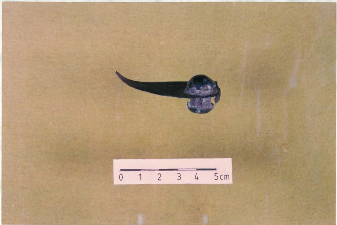
Oulu, Hangas Hangaksentien rautatieylikäytävän läheisyydestä hevosten polkemasta hiekasta löytynyt pronssinen esinekatkelma.