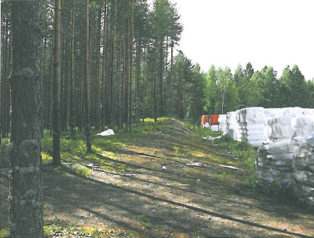
DG444:1 Outokumpu Lahdensuo. Piippo Oy:n tontin rajalla sijainnut pyyntikuoppa 5, tuhoutunut. Koillisesta.