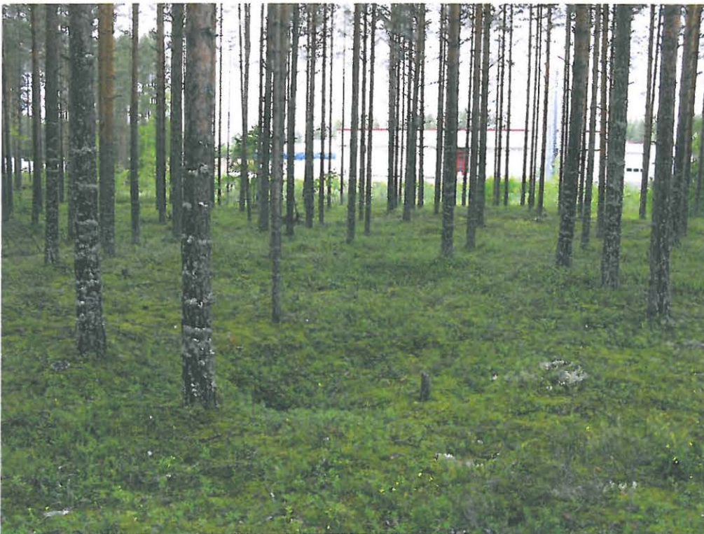
DG444:2 Outokumpu Lahdensuo. Piippo Oy:n tontin rajalla sijaitseva pyyntikuoppa 6. Kaakosta.