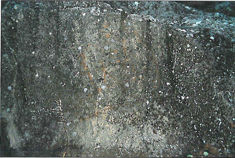
Kuva 1. Kalliomaalaus.