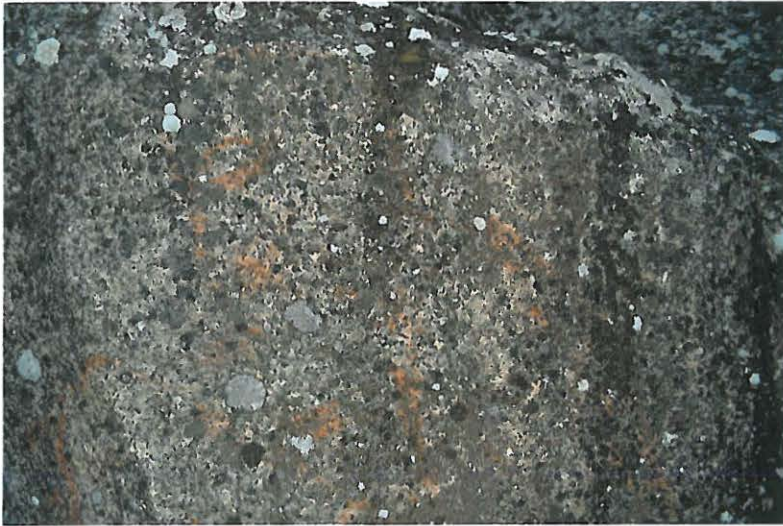
Kuva 3. Yksityiskohta kalliomaalauksesta.