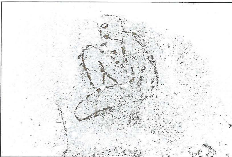
Kuva 2. Maalaus eroteltu digitaalisesti edellisestä kuvasta.