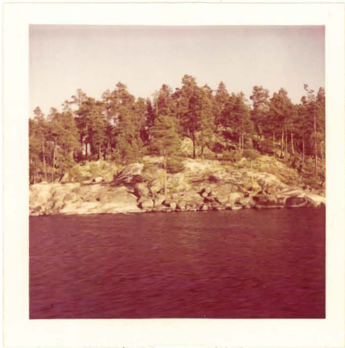
PADASJOEN LINNAVUOREN LÄNNEN PUOLEINEN LOIVA REUNA