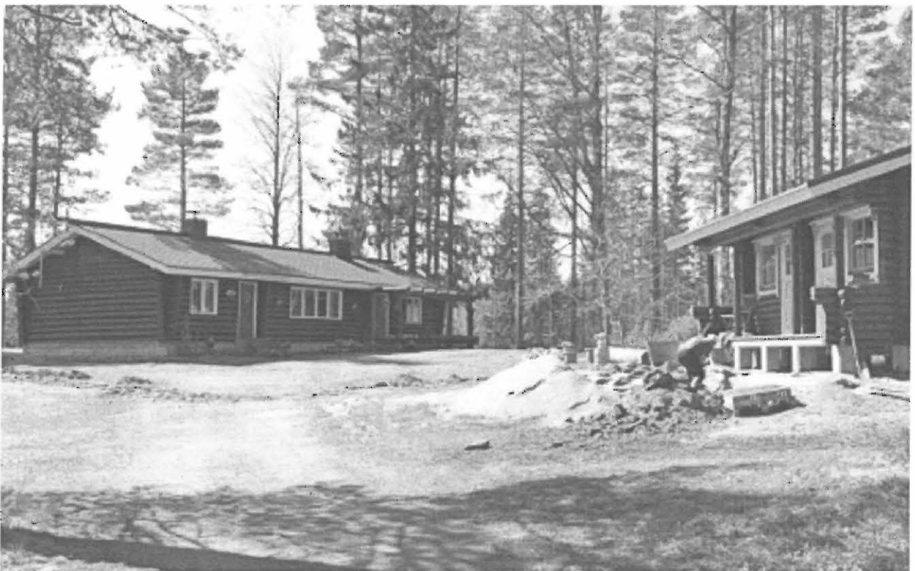
Vasemmalla talo, oikealla aitta. Kuvattu idästä. KaiM 7502:5.