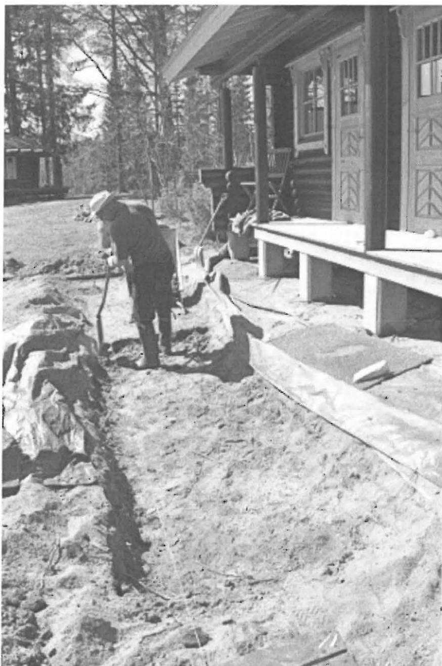
Pentti Turunen kaivaa aitan edustaa. KaiM 7502:4.