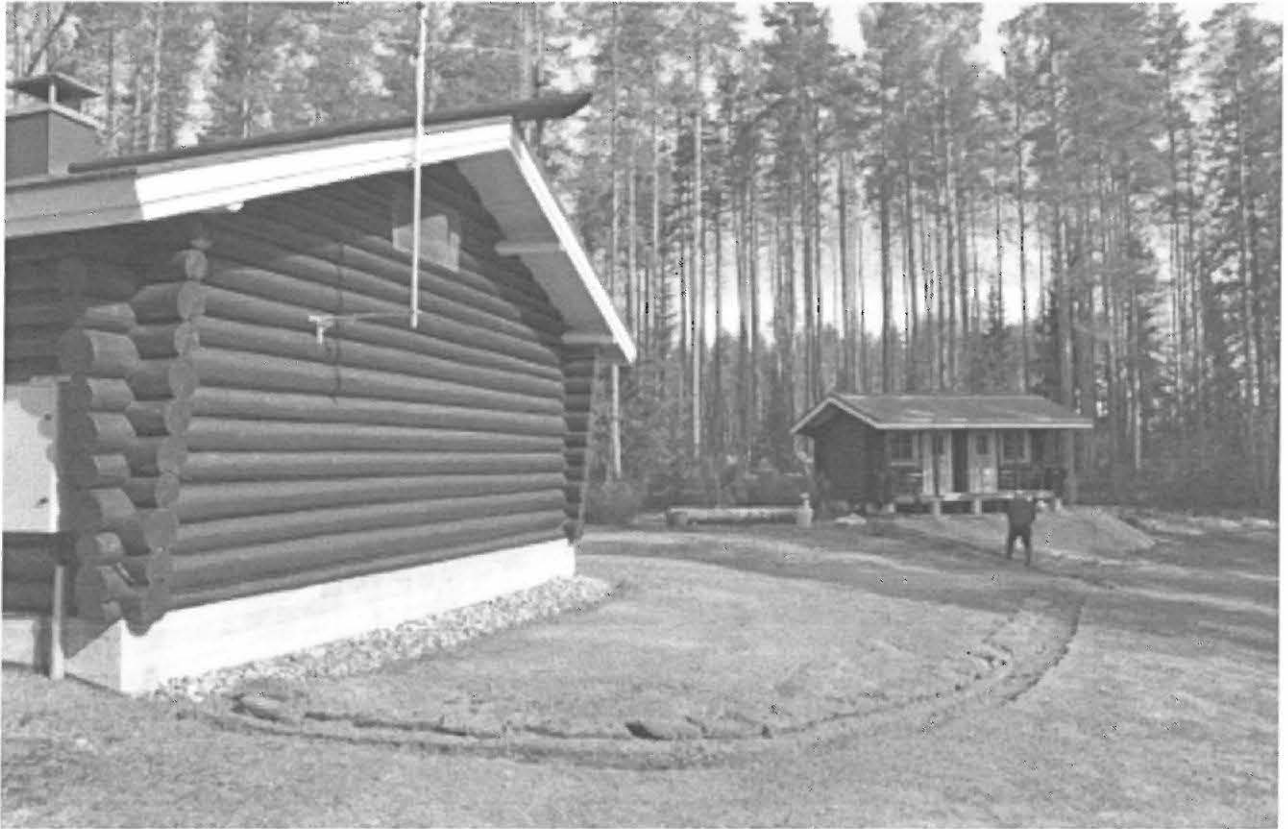
Talon kaakkoisnurkalta aitan eteläkulmaan menevä kaapeliuoja. Kuvattu etelästä. KaiM 7502:2.