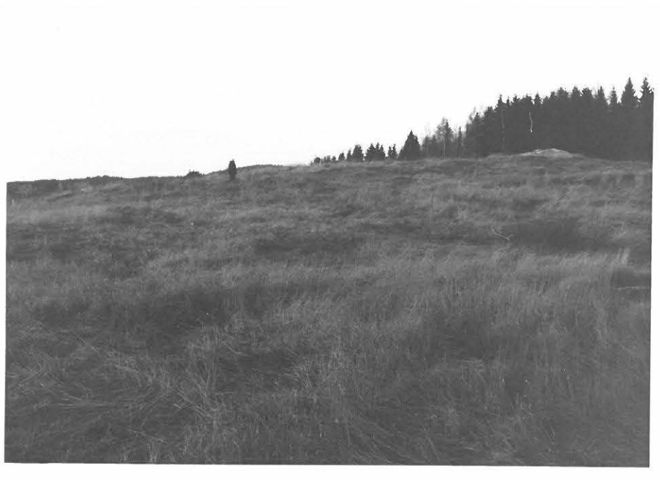
1. Tutkitun kukkulan kaakkoisrinnettä. Juha-Matti Vuorinen kumartuneena koeruudun kohdalla.