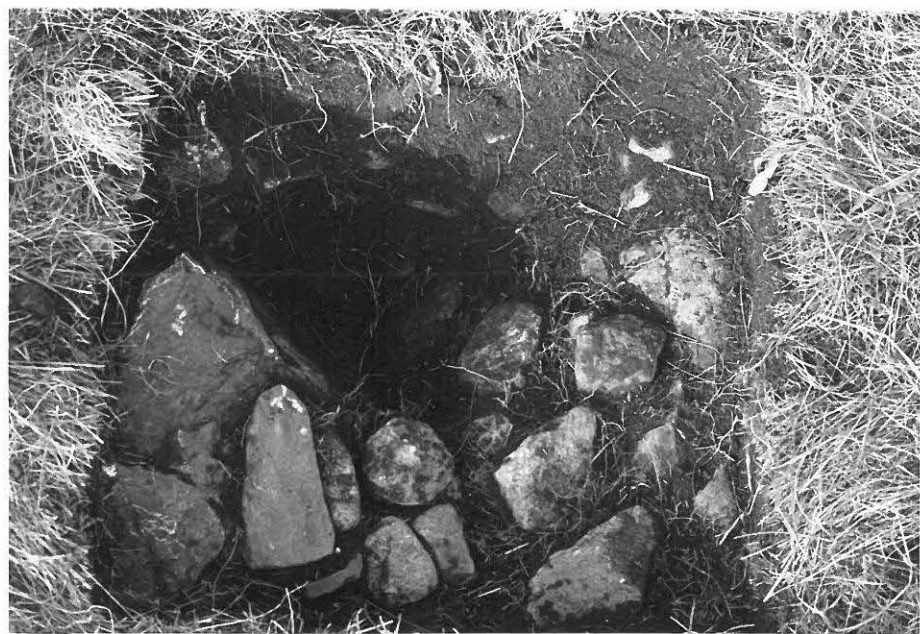
2. Koeruutu kiveyksen paljastuttua. Vasemmasta yläkulmasta on muutama kivi poistettu.