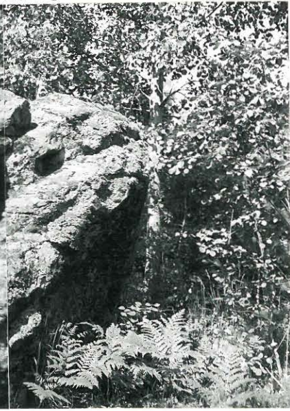
1. PANORAAMA: UHRIKIVI LÖUNAASTA. LUISKAA PITKIN ON KIVEN PÄÄLLE HELPPU NOUSTA.