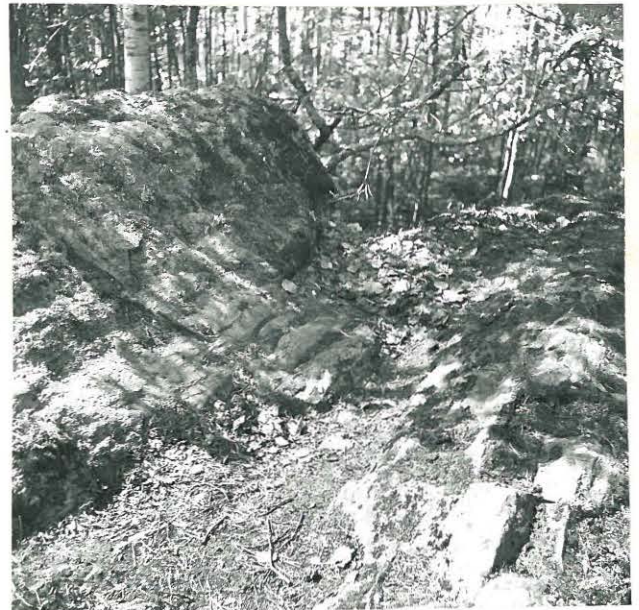
3. UHRIKIVEN LAKEA. VASEM- MALLA HARJANNE, JOSSA KUPIT OVAT.