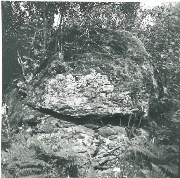
2. UHRIKIVI LUOTEESTA.