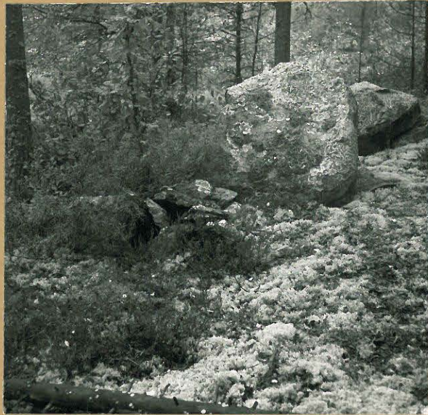
neg. 72050. Uunimainen rakennelma. Itäkoillisesta.