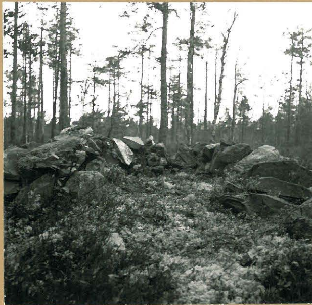
neg. 72049. yhdeltä sivolta ruuki oleva kehämäinen rakennelma. kaakostav.