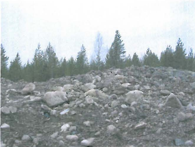
Pohjoinen röykkiö idästä, asuinpaikkalöytöjä etualalta.