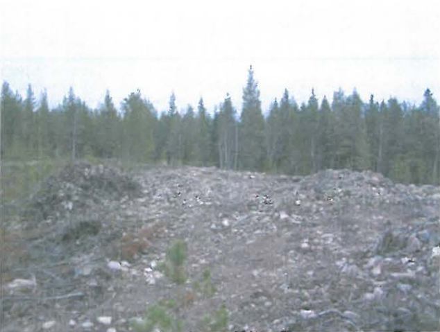
Röykkiöt oikealla, kuorittua länsipuolta.