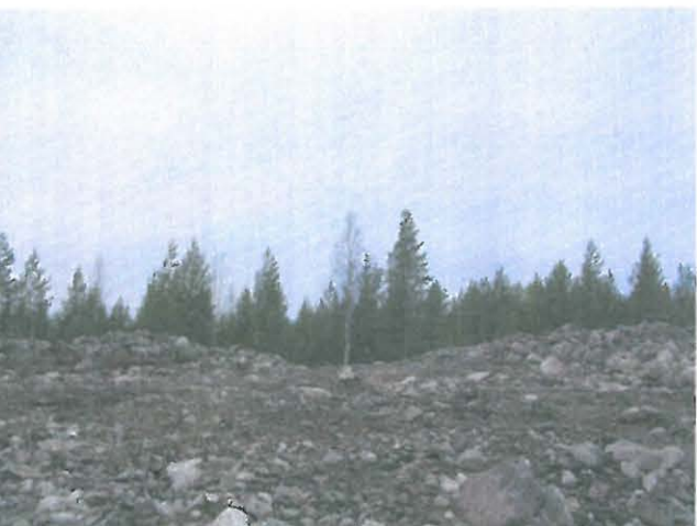
Röykkiöt idän / koillisen suunnasta, kuorittua itäpuolta.