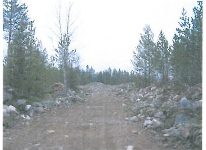
Alueelle lounaasta / lännestä tuleva ajoura.