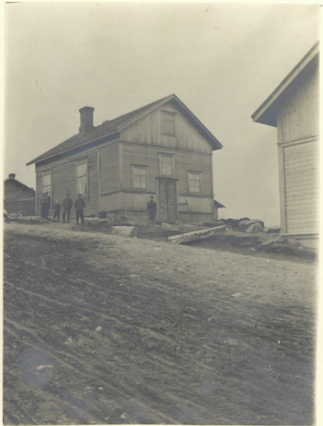
Aug. Färden torppa, jonka lev. 2476. dustalla on kalmisto.