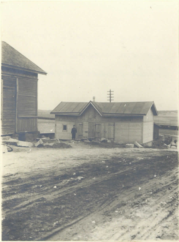
Aug. Färden top. pihamaa lev. 2477. valok. N-suuntaan Poika seisoo löytöpaikalla