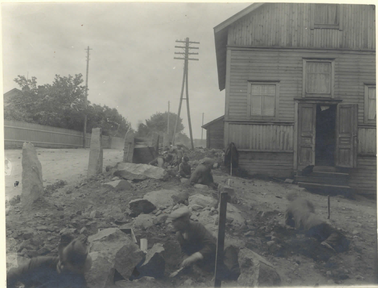
Kalmistoa Aug. Färden top. pihalla tutkitaan lev. 2495.