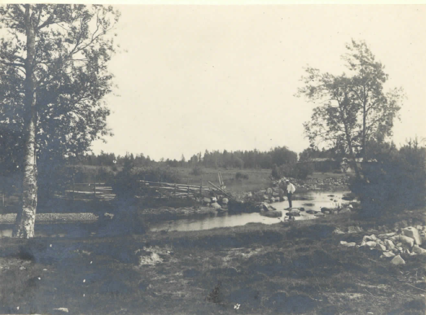
Lautjärvi, Koittaankoski L. 131 2455