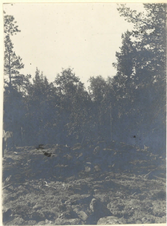
Hidenkivas I L. 131 2457