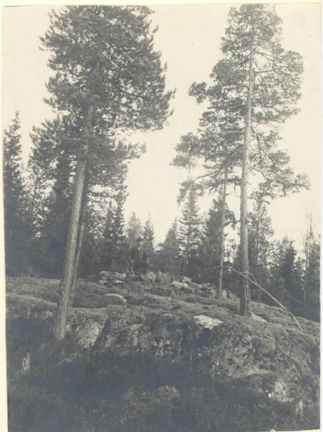
Hidenkivas X L. 131 2458