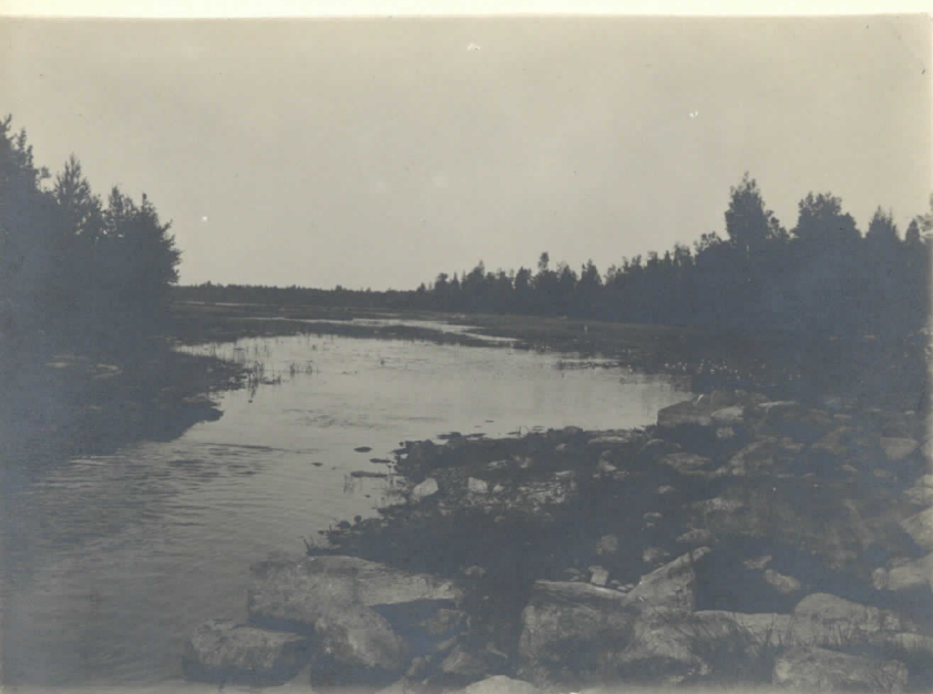
Koittaanjärvi L. 131 2456