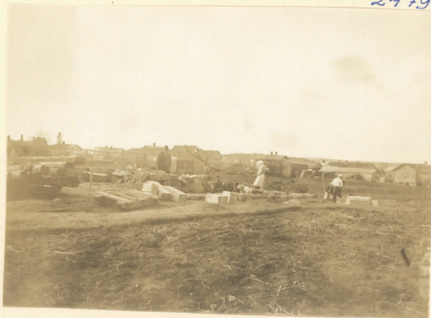
Mesomkylä, Hiittala, Kukkosenkiven)- mäki: rakennuksen perustus laivaus- ten kestävissä kes. 1913. N-puolel- ta S-suuntaan.