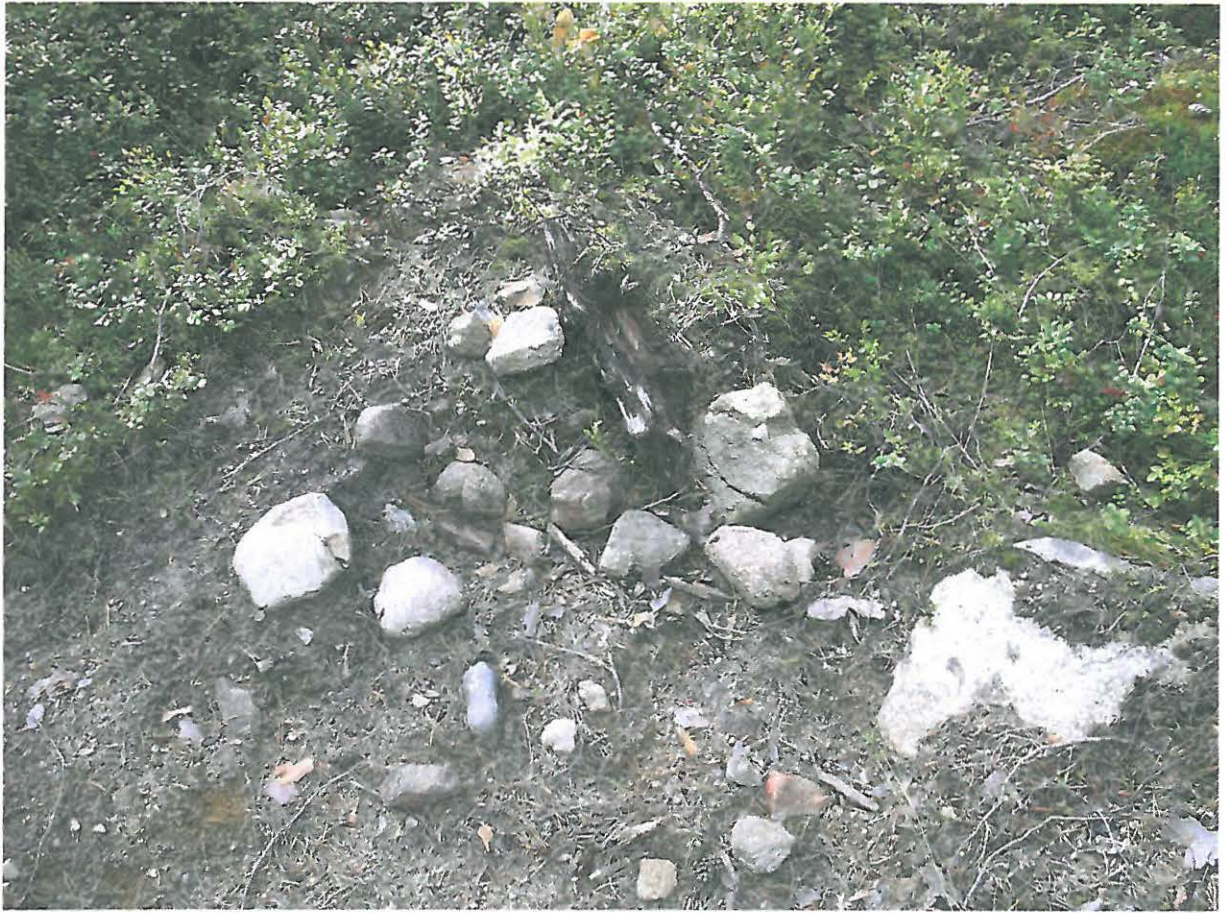
Kuva 1. Liedestä ovat jäljellä tieleikkauksesta esiin pistävät palanneet ja rapautuneet kivet.