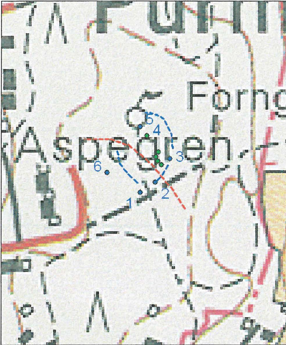
Vihreä väri- røykkiö ilman keskuskiveä. Sininen väri- røykkiö keskuskivellä. Punainen katkoviiva- uusi kuntopolku. Sininen katkoviiva- kiviaitaa selvästi näkyissä.