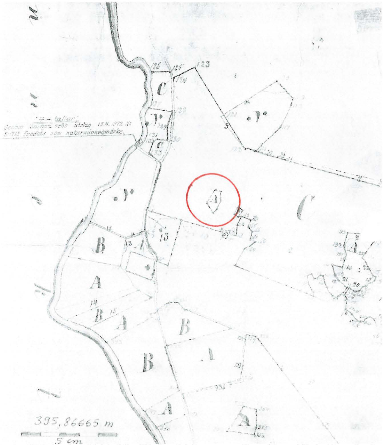
Vuoden 1875 isojaon karttalehtiteksti: Storskiftesräerne hela hemmanen emellan, uti Purmo skifteslag i Purmo kapell af Pedersö socken af Wasa län; upprättad vid verkställd räupstakning år 1875 af E.J.Grönroos. Förrättningen N:o 2447. Kartan ala A= Sisbacka hemman Aspegrens kapellansbo (=boställe). Kartalla 15 cm =4000 fot ja 1 fot 0,2969 metriä, kuvaan on merkitty mittakaava, mikäli tulostus ei vastaisi alkuperäistä kuvaa. Kartalla rajapyykkien numerot ovat 134-139 siten, että 139 on määräalan eteläisin pyykki ja siitä alenevassa numerojärjestyksessä vastapäivään loput.