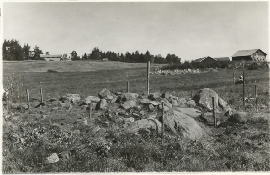
Valok. 11877. Yliopp. Väätäinen - 38. Mikkelinj. Kyökkylä Parassalmi. Ruusio II, suunta, kiltinen.