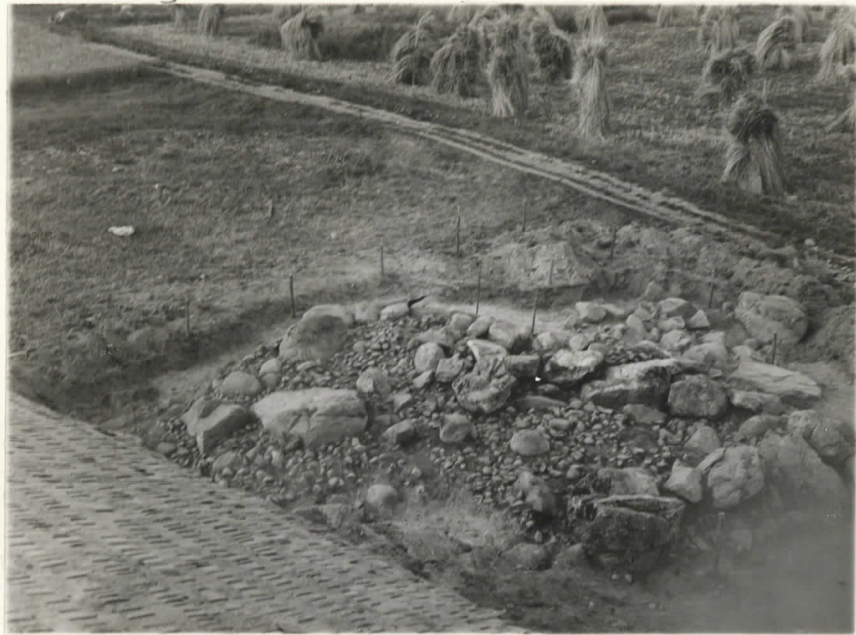
Valok. 11863 Yliopp. Väätäinen -38

Mikkeliinj. Kyyhkylä, Parassalmi. Runnion IX radon katolte va- loluurattuna. Suunta- on koillinen.