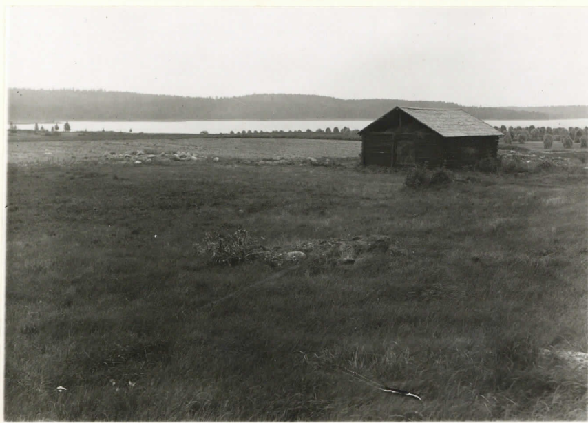
Valok. 11835 J. Leppänen -37 Kuva kuin yllä, kadosta vasemmalle röykkiöt II ja III. Suunnasta kaakko.