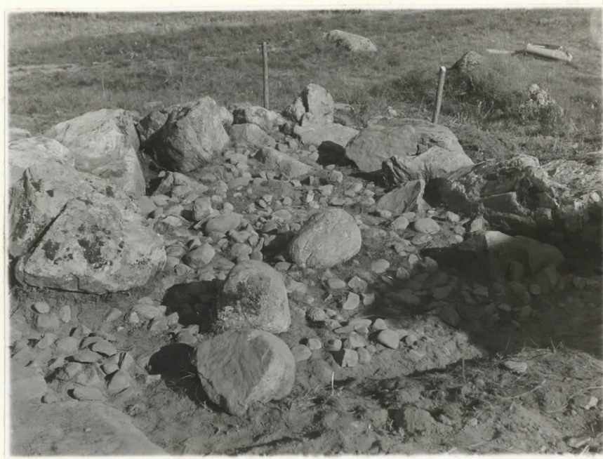
Valok. 11861 J. Leppäaho -38 Valok. 11862. J. Leppäaho -38. Mikkelin p. Kyökyhytä, Porassalmi. Raamio IV, printa- kerron kaupista altaan puhdistettuna. Suunta kivilis-kah- ko. (mittari)