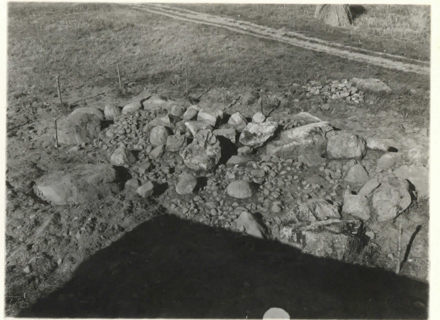
Valok. 11865. Yliopp. Väätäinen -38

Kuvissa 11865-66 ei itäreunassa ole "hylkiäinen" ole vielä kaivettu esiin.