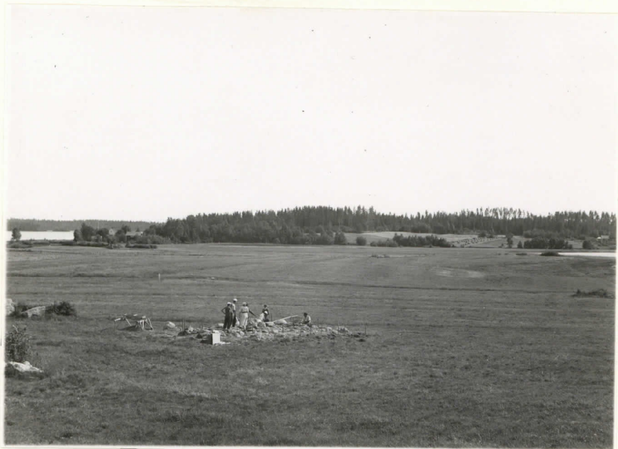
Valok. 11870 J. Leppäaho - 38. Kuin yllä, rannio V tutkimusten alaisen. Suunta kutakuinkin etelä.