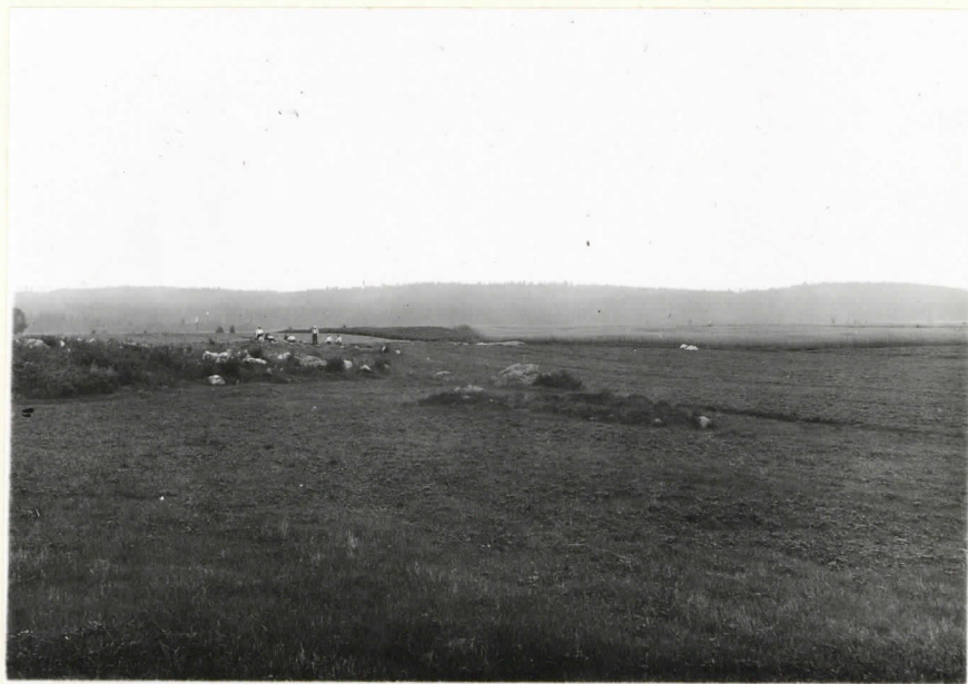
Valok. 11834 J. Leppänen -37 Kuva kuin yllä, valokuvattu Porassal- men tien vieressä olevien perunakuvu- painin kohdalla. Suunnasta itä-kaakko.

alalla röykkiö V, valokuva suunnasta poh- jois-koillinen.