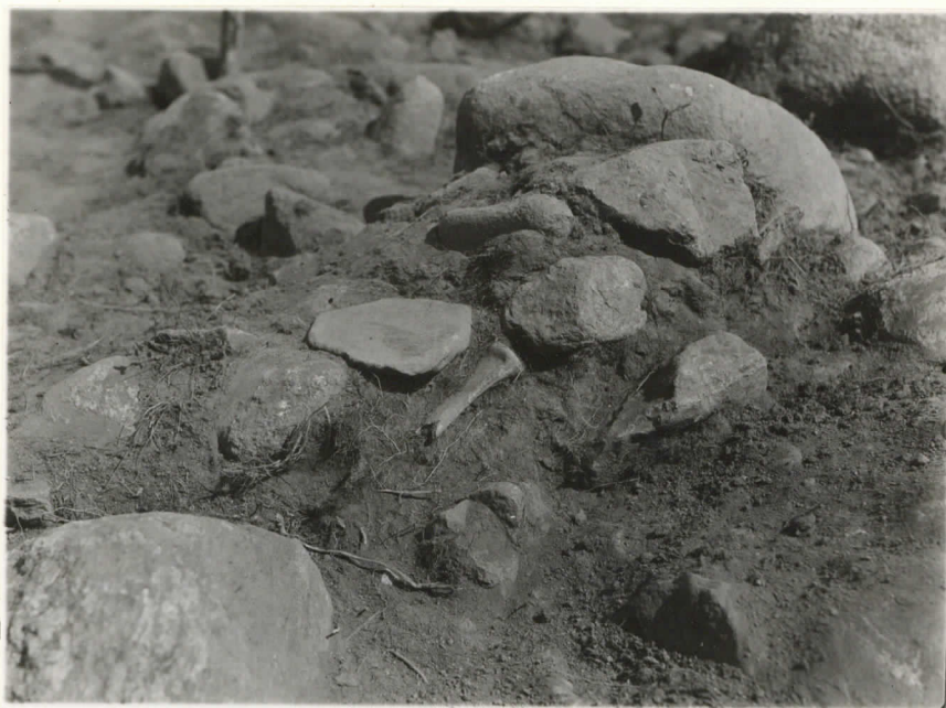
Valok. 11876 J. L. Eppäaho - 38. Kain piiri. Rannio V. Suurehkö - maki(?) eläimen luita run dassa III B (1086E; - 92) Suunta pohjoiskoillinen.