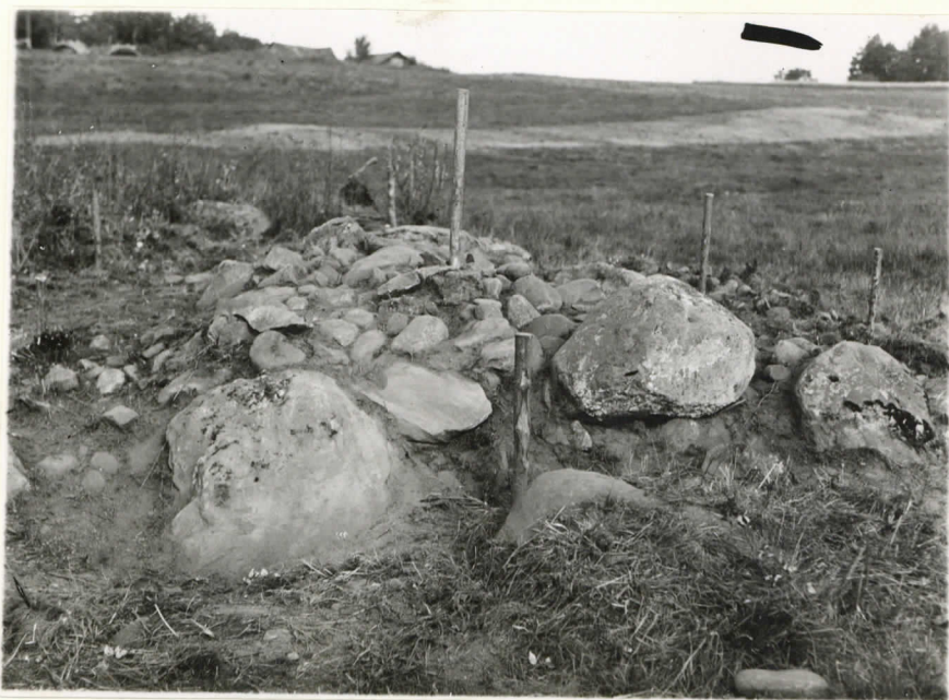
Valok. 11879 Yliopp. Väätäinen - 38. Kuva kuin yllä. Suunta luode.