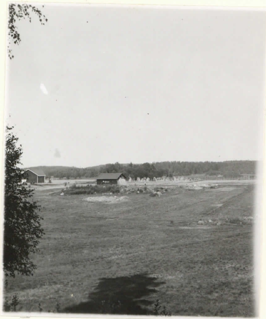
Valok. 11837 Yliopp. Väätäinen-38 Kuvaa kuin yllä.