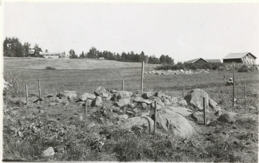
Valok. 11878 Yliopp. Väätäinen - 38. Kuva kuin yllä.