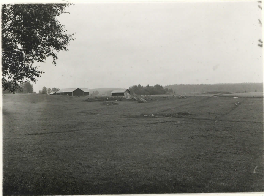
Valok. 11833 J. Leppänen -37 Mikkelin Kyyhäytä, Porassalmen pellon kalmisto - Porassalmen tien vierestä, ku- takuinkin muistomerkin kohdalla valoku- vattuina, etu-

alalla röykkiö V, valokuva suunnasta poh- jois-koillinen.