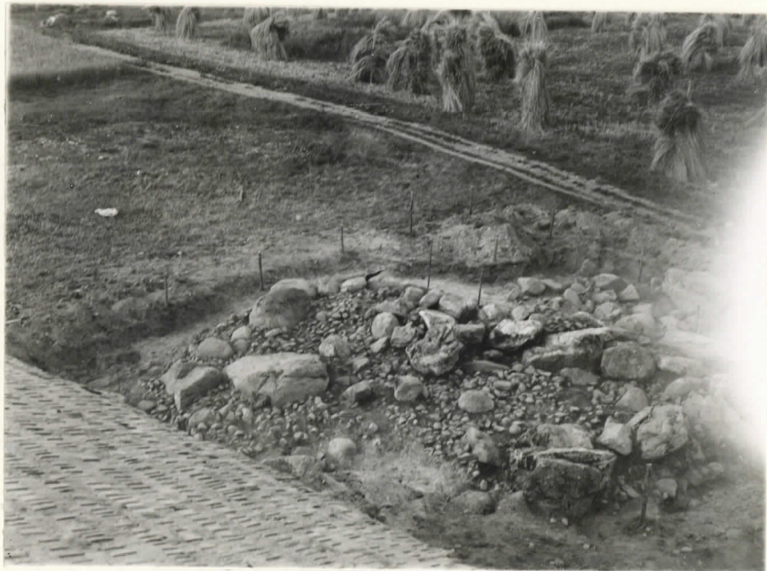
Valok. 11864. Yliopp. Väätäinen -38