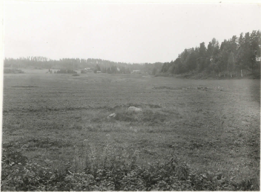
Valok. 11869 J. Leppäaho - 38. Mikkelinj. Kyöskylä, Porassalmi. Ransio V ennen turpeiden päästämistä. Suunta lounas. Oikealla tekona Porassalmen taistelualue.