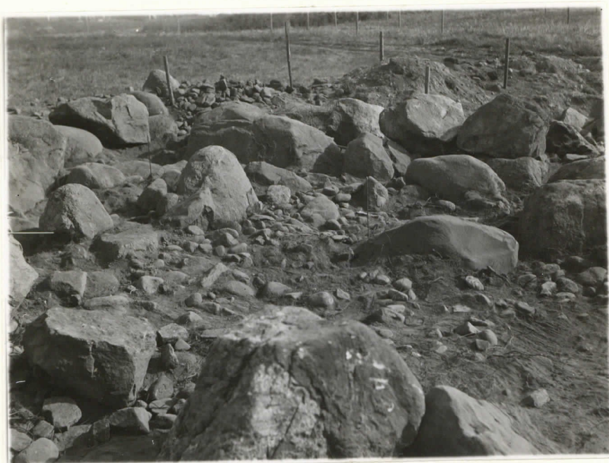
Valok. 11868 g. Leppäaho - 38. Kuin yllä, Rannio IV:n kiveysti, Suunta itä-koillinen.