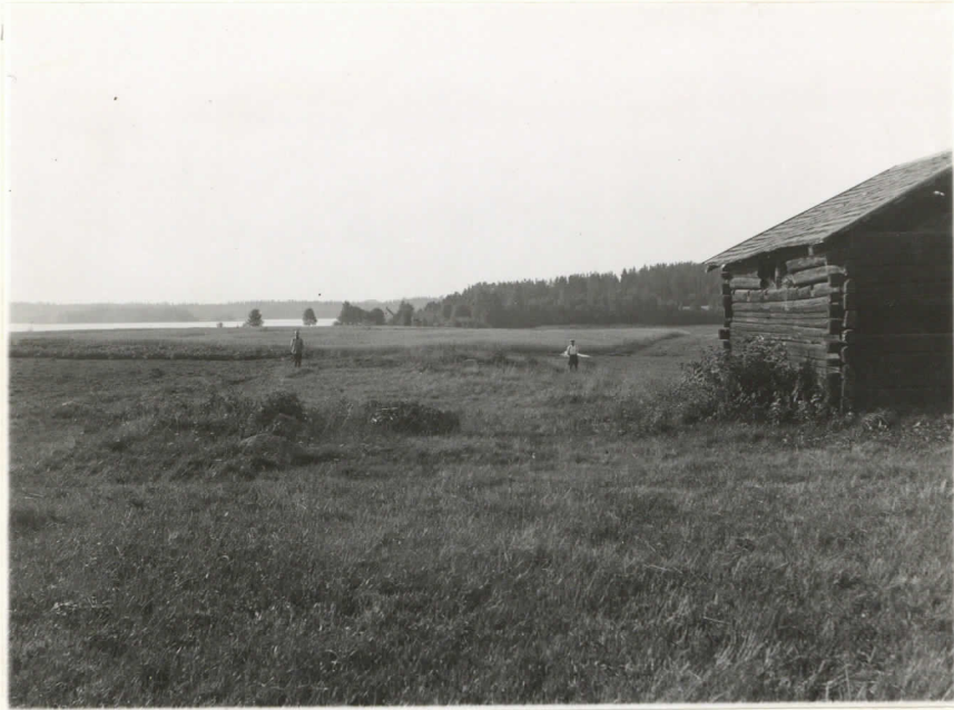
Valok. 11859 J. Leppänen - 37 Mikkelinpr. Kyykkylä, Paras salmi Riihkiö IV ennen turpeiden pois otte- mista. Suunta etelä.