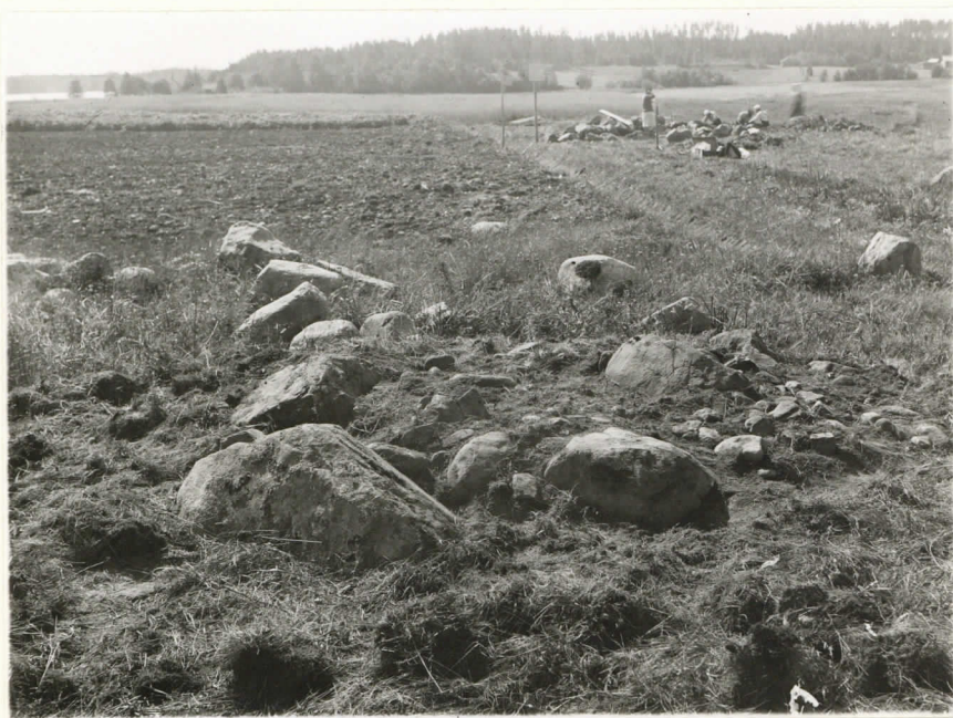
Valok. 11855 J. L. Eppriäho - 37 Kuivayllä, rannio II turpeista paljas- tettuina. Suunta itä.