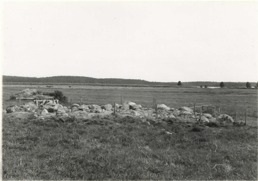
Valok. 11875 J. L. Eppäaho - 38. Mikkelin piiri. Kyykkylä, Porrasalmi. Rannio V tutkimusten jälkeä. Suunta kutsuvuonon kaakko.