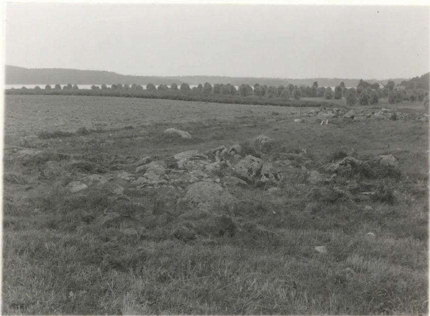
Valok. 11860 J. Leppänen - 37 Kuin edellä, Riihkiö IV turpeista paljastettuna. Suunta etelä-kau- ko.