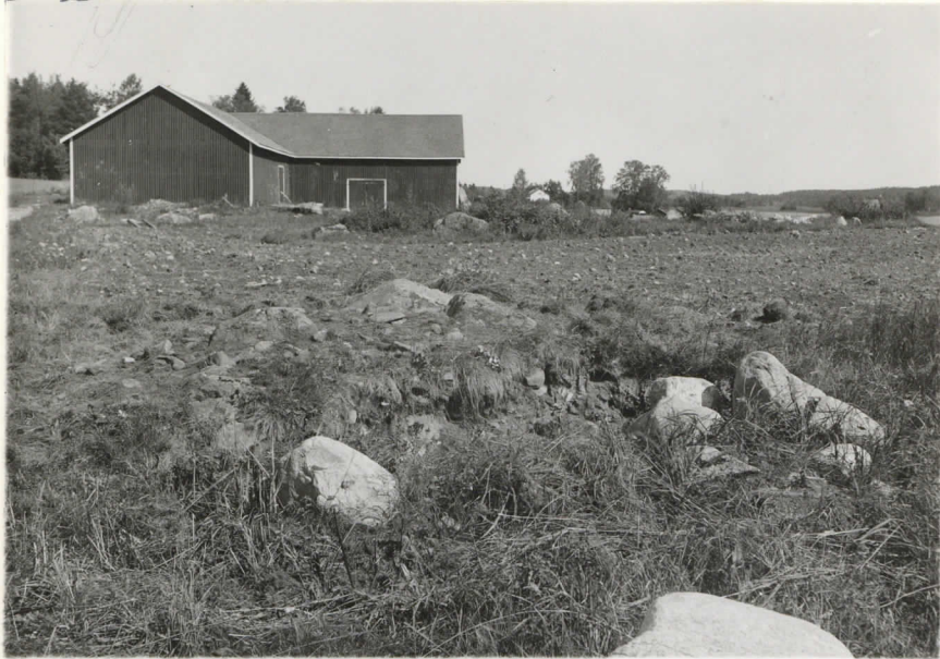
Valok. 11854 J. L. Eppriäho - 37. Kuivayllä. Keskeillä rannio II turpeista pal- justettuna. Oikealla rannio III. Suunta pohjoinen.