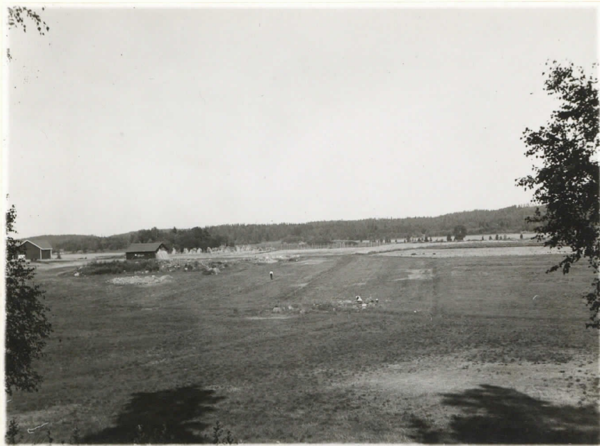
Valok. 11836 Yliopp. Väätäinen-38 Mikkelinp. Kyöskkytä, Porsassalmen kal- mista. Kuvan ottopaikka ja suun- ta kutakuinkin sama kuin n:o:ssa 11833. Kuvaa on otettu tutkimusten jälkeen.