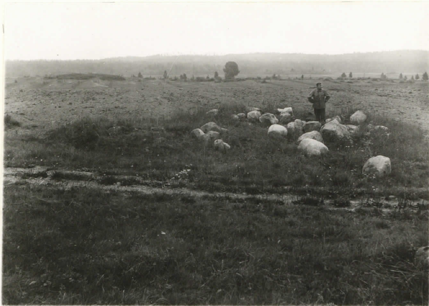
Valok. 11853 J. L. Eppriäho - 37. Mikkelin, Kyykkylä, Porrasalmi, Invaliidi Triikki sersse kapparan ja heikänkärjen löy- tön paikalla (10476:1-E), vasemmalla rannio II. Suun- ta on itä.