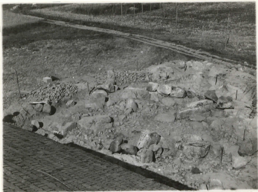
Valok. 11867. - 38. Mikkelin p. Kyökykylä, Porsasalmi, Rannio IV kaden katolta valokuvattu. Suunta koillinen