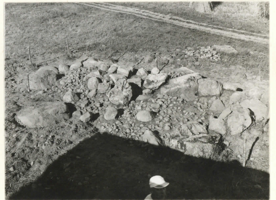
Valok. 11866. Yliopp. Väätäinen -38.