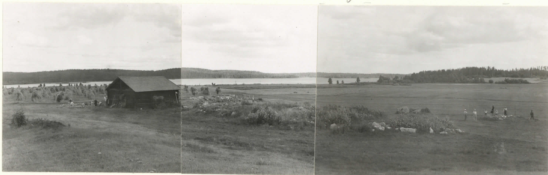
Valok. 11838-40 y. Leppäaho-38. Mikkelinr. Kyyhkylä, Pannasalmien kalmissa, Pano- raama kuva. Ladosta vasemmalle rökkiö IV ja oikealle run- niö I. Äärimmäisenä runniö V. Keskisunnun on kaakko.