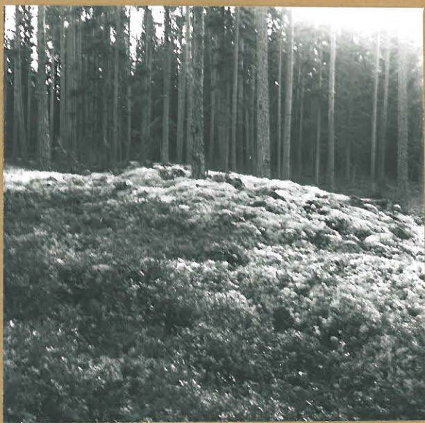
Eteläisin alueen kalimesta \phi . 59504 röykkiöstä. NE.