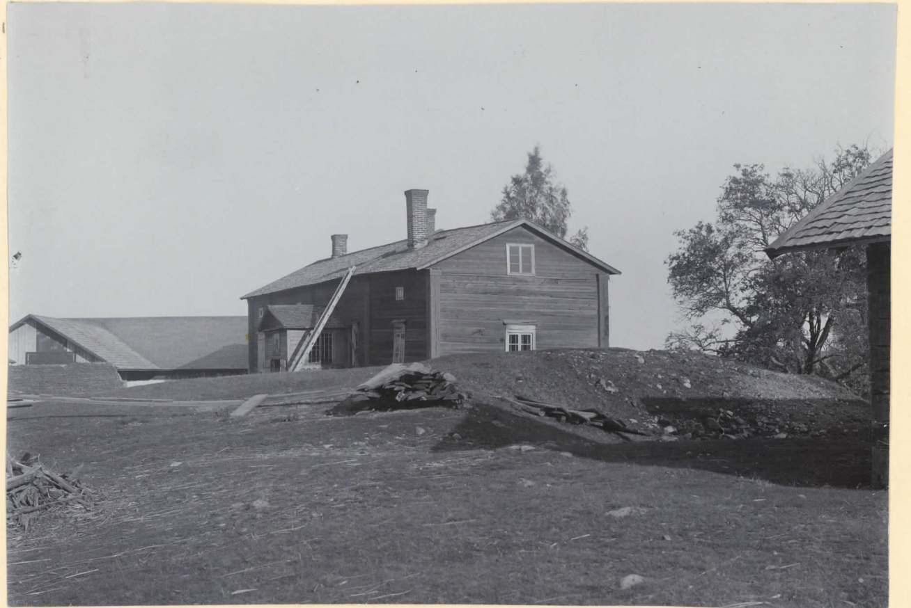
3. Fyndstället från äldre järnåldern på Franthila hemmans gård. H. M. 5269.

Franthila hemman i Viimo. Pl. III A. Hackman 1909.