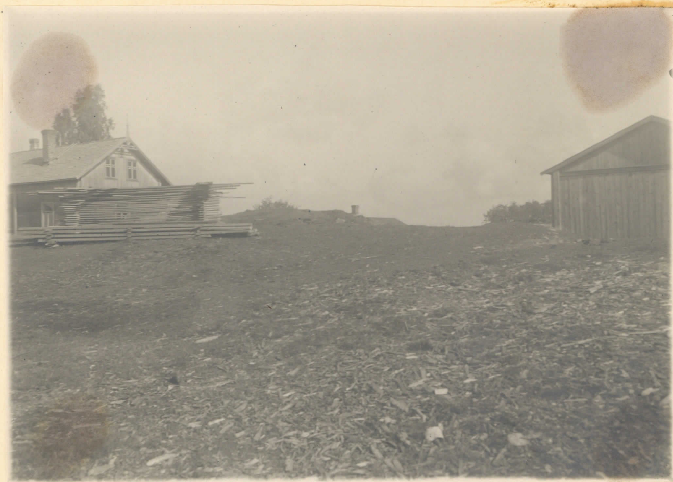
Franklin - unusu i, Virva. Pl. IV