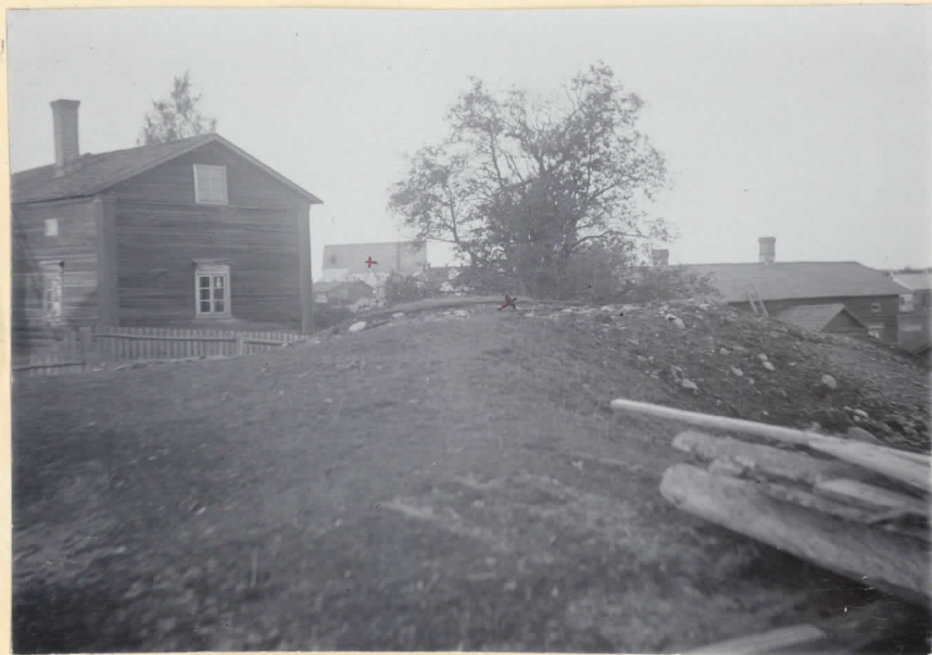
2. Fyndställe (gröffält) från äldre järn- åldern på Franthila hemmans gård. (H. M. 5269). Vid + Viimo kyrka