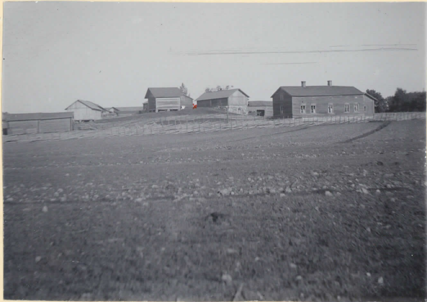
1. Franthila hemman i Turseu-perä by. Vid x ett fyndställe från ä. järnåldern. H. M. 5269.