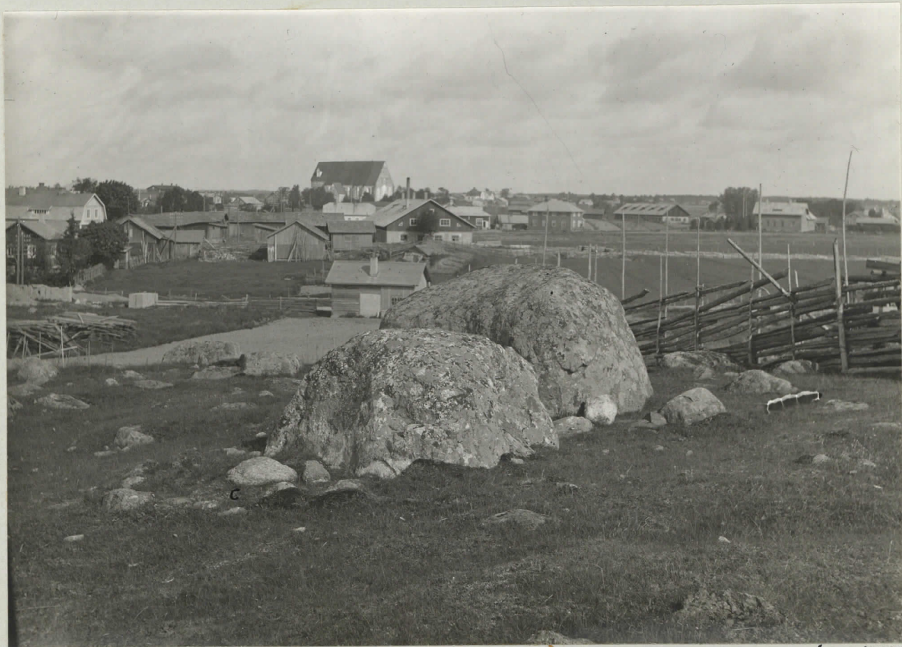
3. Hauta a Myllymäellä katsottuna SW:stä SO-päin