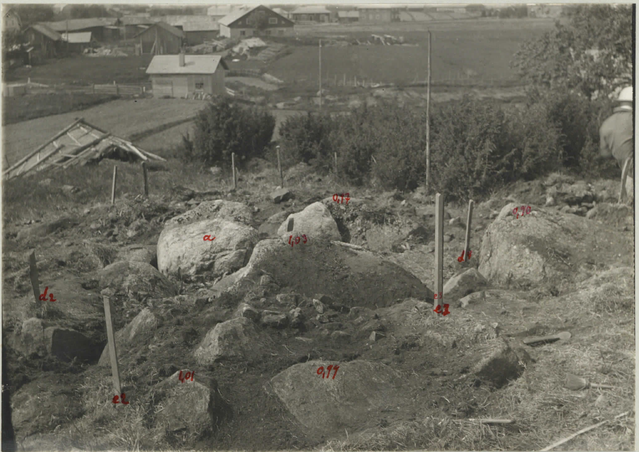
1. Näköala Myllymäeltä NW-päin. Etualalla hautaruunio a, taustassa Mynämäen kirkko.