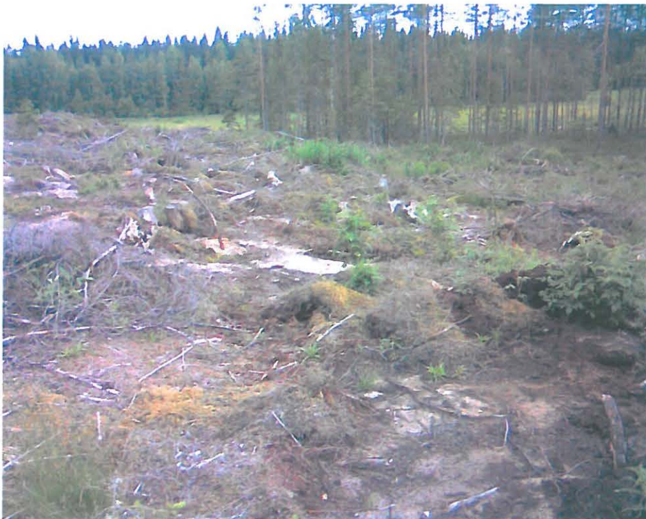
Hemmola kuvasta oikealle, harjanteen länsipää rajautuu peltoon, kohti W.

Pysähdyin ohikulkiessani 2.7.2010 tarkastelemaan Tölväänkankaan länsireunaan tehtyä aukkohakkaus- ja metsälaikutusaluetta, joka ulottuu Hemmolantien Kuivaniementiehen yhdistävän maantien reunaan. Idän suunnassa hakkuualue ulottuu hiekkakuoppaan saakka. Havaitsin aurasjäljissä kvartsi-iskoksia, eniten kohti luodetta (Hemmolan peltoja) laskevalla hiekkaharjanteella. Harjanteen lännessä peltoon rajautuva kärki oli löydötön, ja idän suunnalla lakea kohti nousevassa rinteessä ja ylemmällä korkeuskäyrällä näkyi vähän kvartseja muttei enää laella. Hiekkakuopan reunojen leikkauksissa näkyi moreenihiekka, ei mitään asuinpaikkaan viittaavaa.