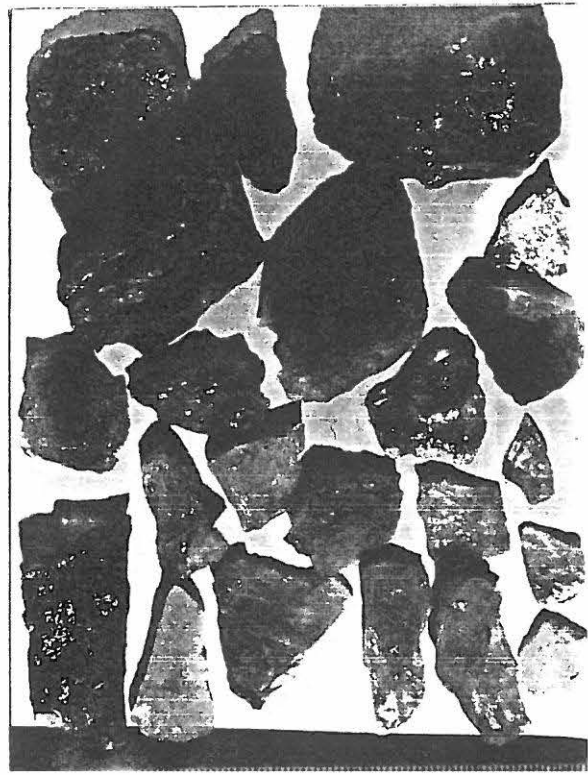
fa. 4079 KUVA 2: KVARTSI-ISKOKSIA TARKASTUS- ÖYDÄNÄ.