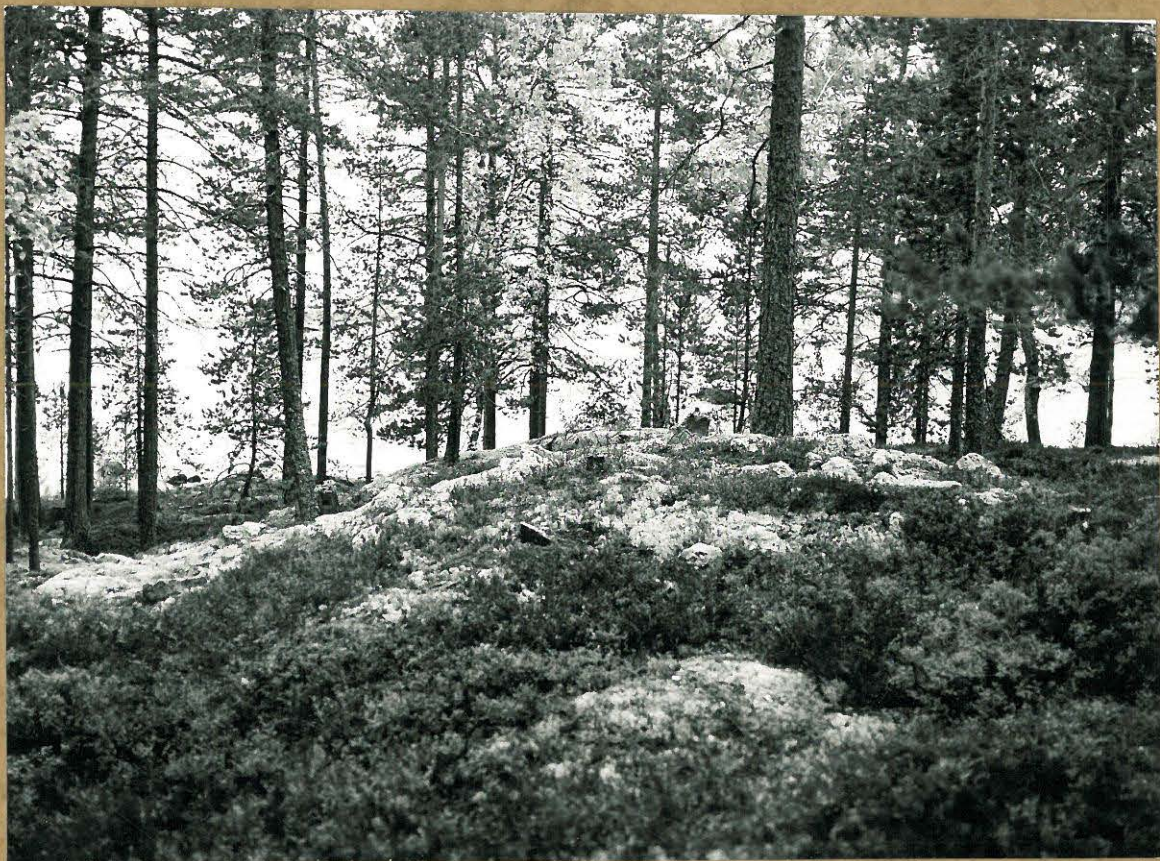
Sama etelästä F.a. 3932