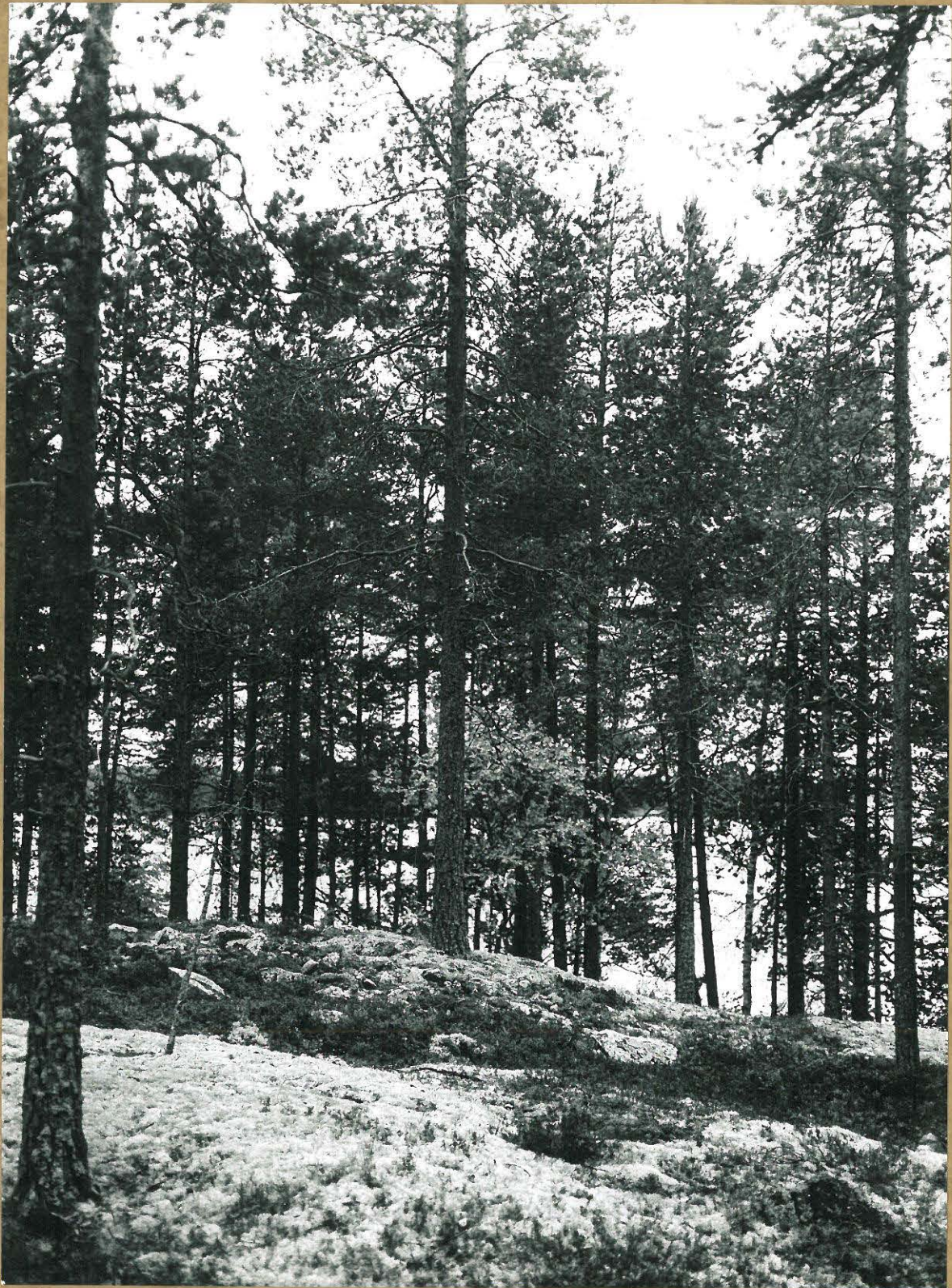
Lapinraunio (2.637.) itäkoillisesta nähtynä F.a. 3930