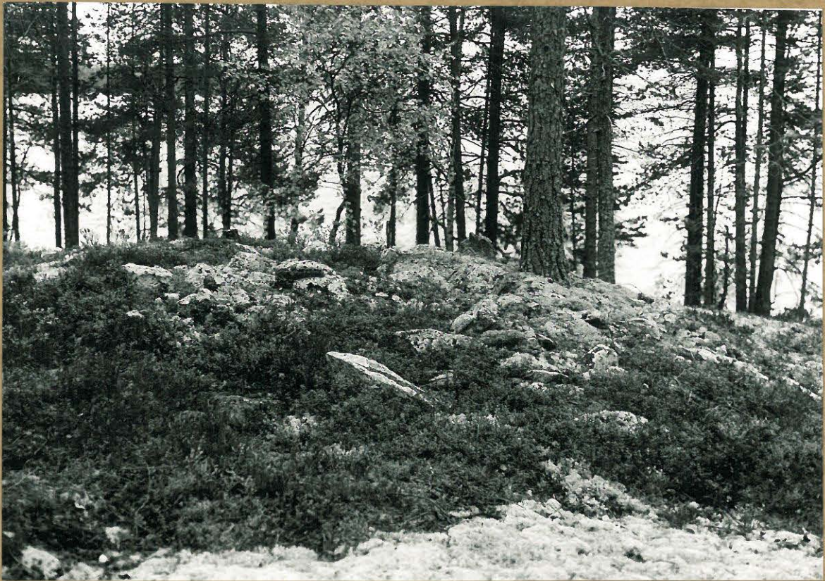
Lapinraunio (2.637.) kaakosta F.a. 3931