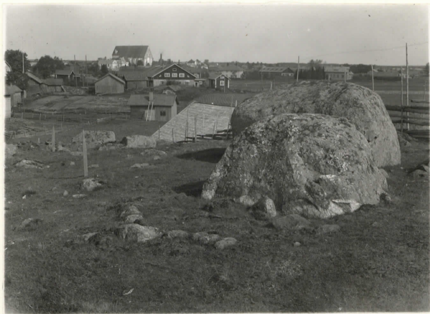
1. Keijaisten Myllymäki W:stä päin.