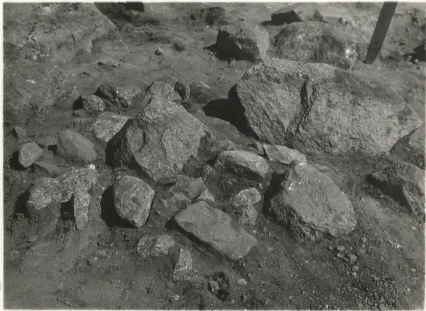
7. Liesi N o 1 (ruutu b 6: ssa), valok. S: stä päin.