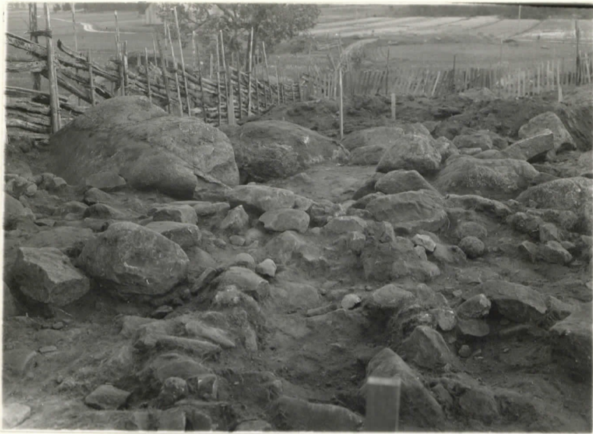
l. 12615. 3. Kiveystä roudissa c b: 14-13, NW:stä päin.