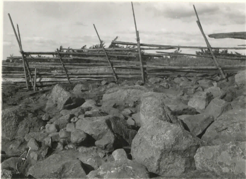
l. 12616. 4. Kiveystä roudissa e f: 15:ssä.