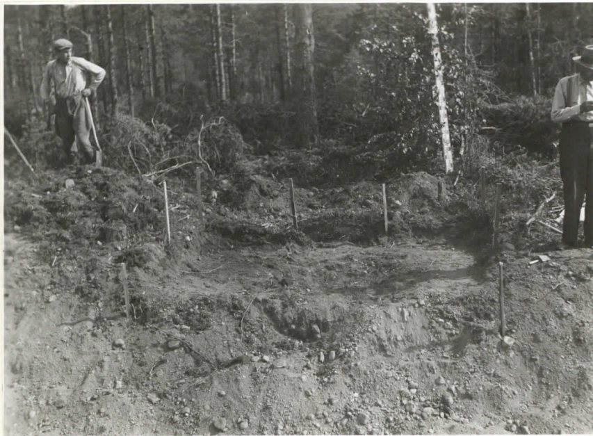
Venekirveshauta lännestä Ylin humuskerros goistettu. Kirves löytyi tien reunan kaivetuista kuopista.