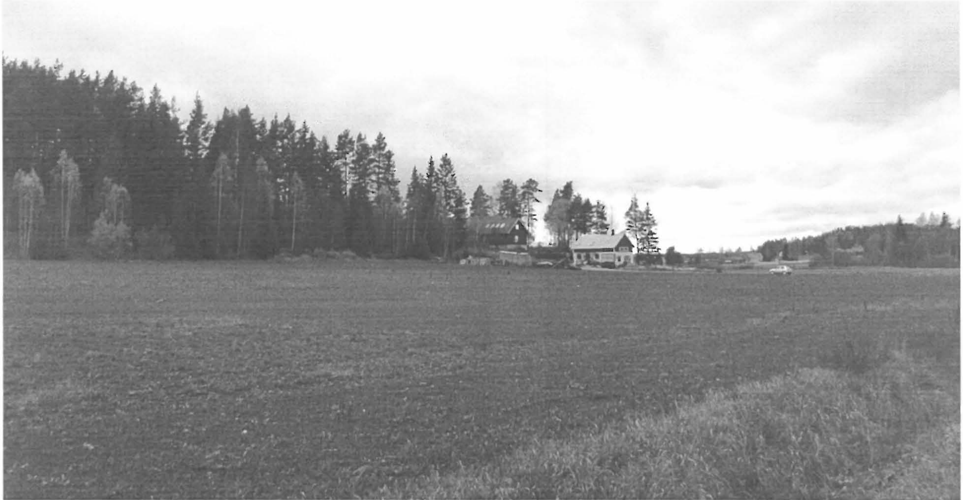
Pertteli Ojanperä W. Yleiskuva. Kuvattu kohti suuntaa NW.