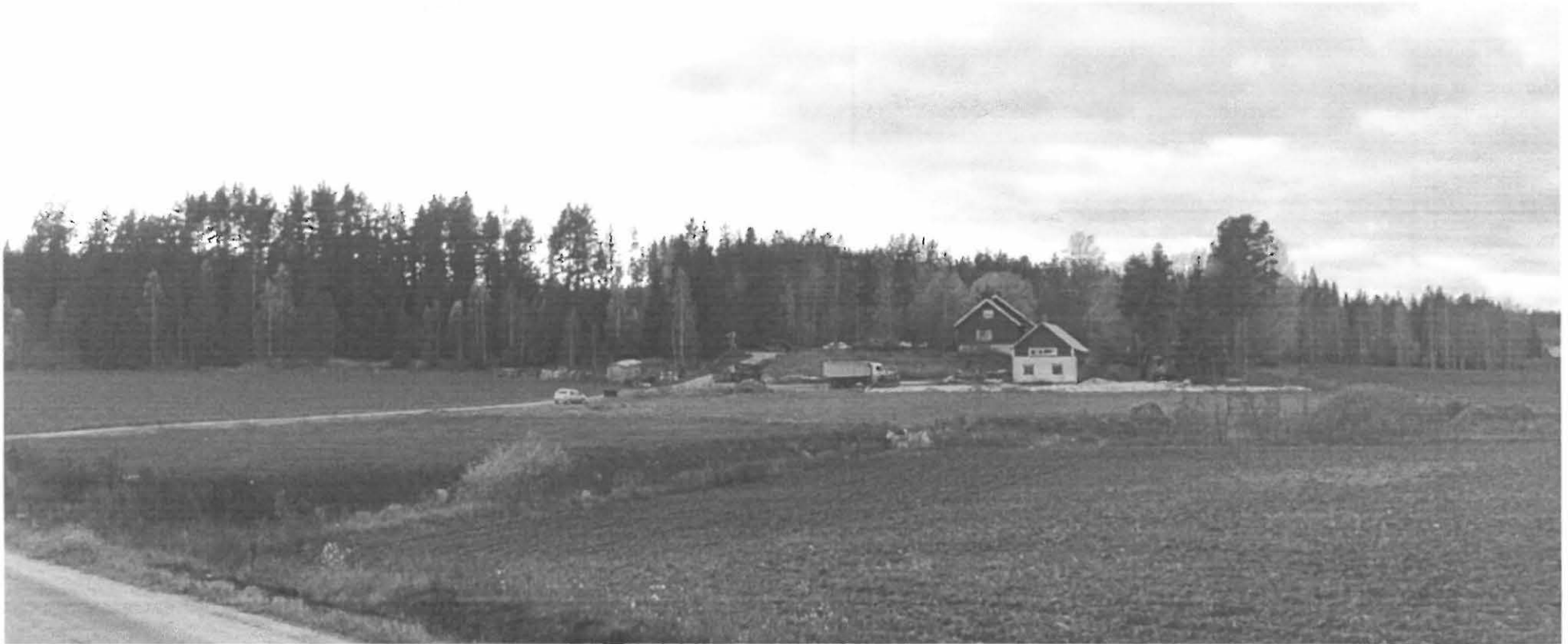
Pertteli Ojanperä W. Yleiskuva. Kuvattu kohti suuntaa SW.