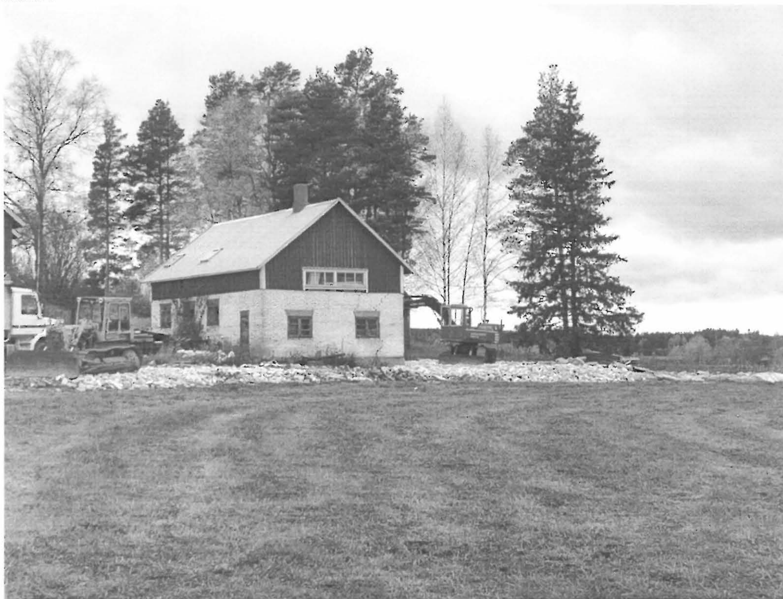
Pertteli Ojanperä W. Täyttömaata asuinpaikan reunassa. Kuvattu kohti suuntaa NW.