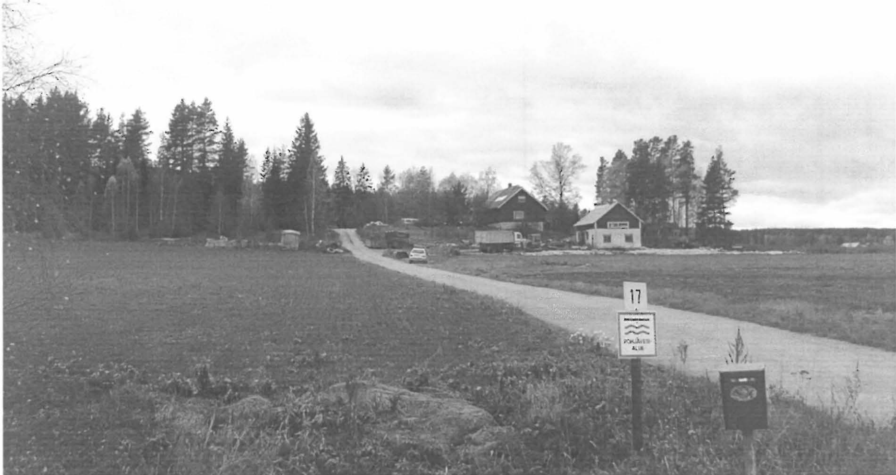
Pertteli Ojanperä W. Yleiskuva. Kuvattu kohti suuntaa W.