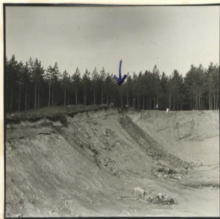
F. 77466 Osa Puosin hiidenkuisaan valokuvattuna itästä, vastakkaisella suunnalla. Nuden kohdalla hiidenkuisaan jään mörköt ja siitä alas kuoppaan sortuneita kiviä.