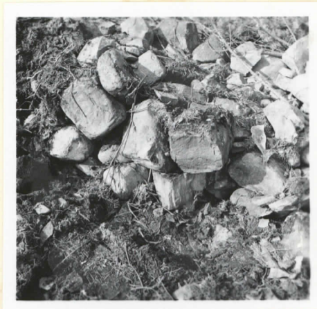
F. 77465 Osa hiidenkuisaan jäljellä olevaa osaa, profuilia ennen kivien poistamista ja ketä renkään paljastumista.