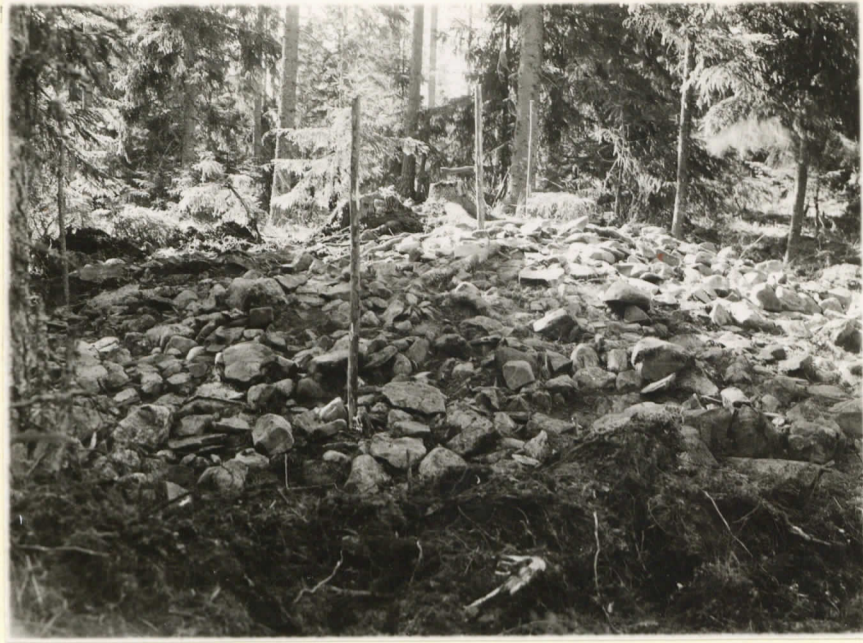
11020 1. Röykkiö paljastettuna. Valok. O:sta päin.