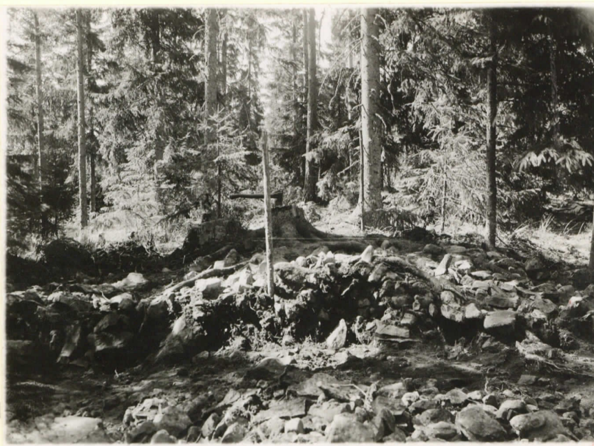
11022. 3. Poikkileikkaus linjalla AB, va- lok. O:sta päin.