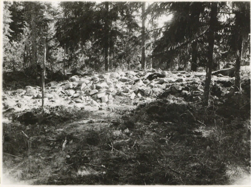
11021. 2. Röykkiö paljastettuna ja valokuva- tuna N:stä päin