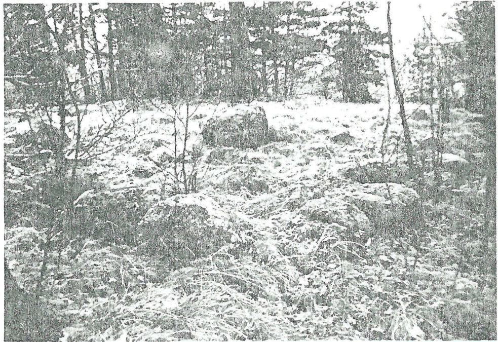
TYA 7800 Hauta luoteesta. Raustalla Kuusiston salmi ja 7800 linnan rauniot. Keskellä silmäkivi.