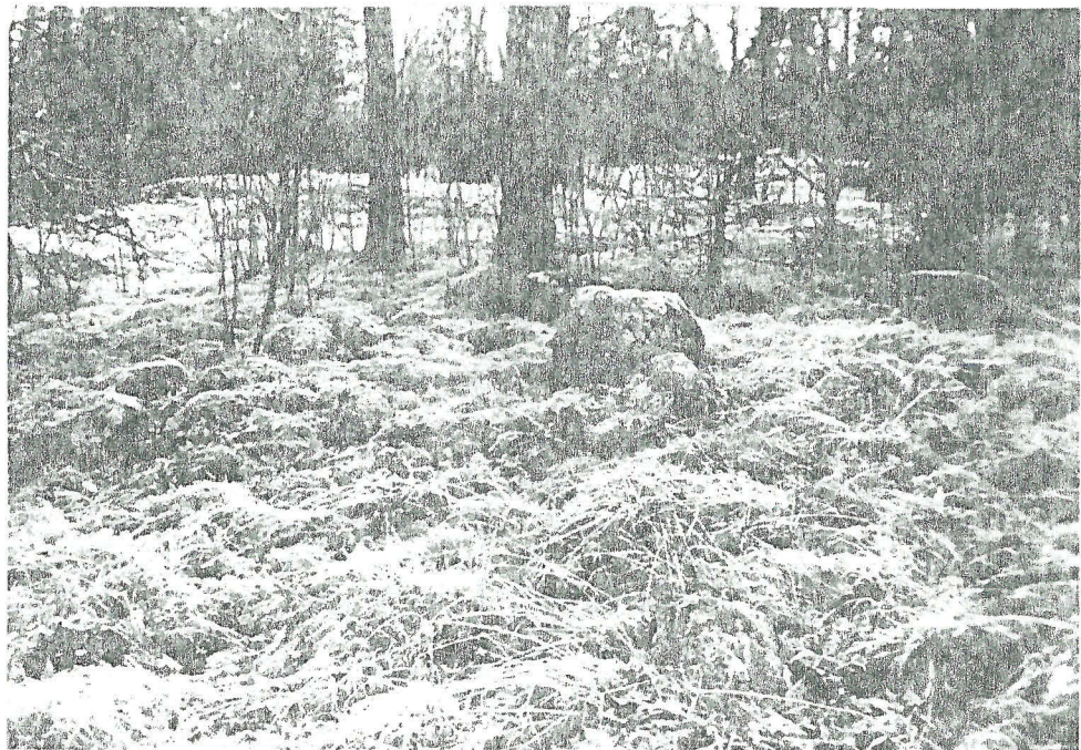
TYA 7801 Hauta etelästä. Keskellä silmäkivi.