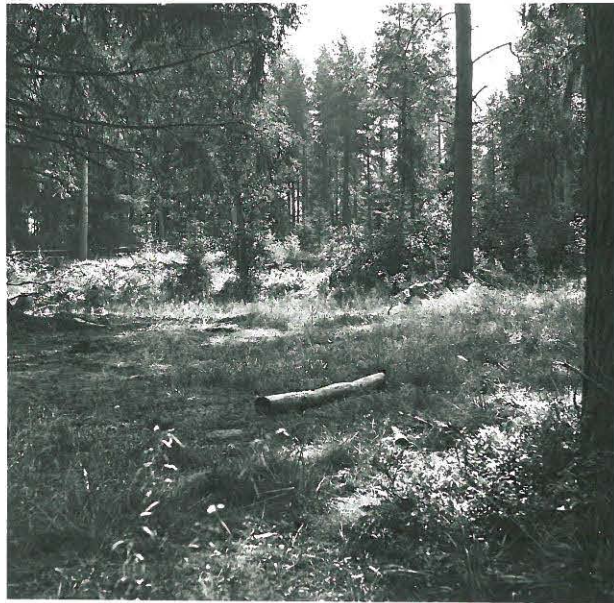
Virranniskan kirikköalueen asuin- paikka, printtaama ajettu pois, kuvattu lounasta.